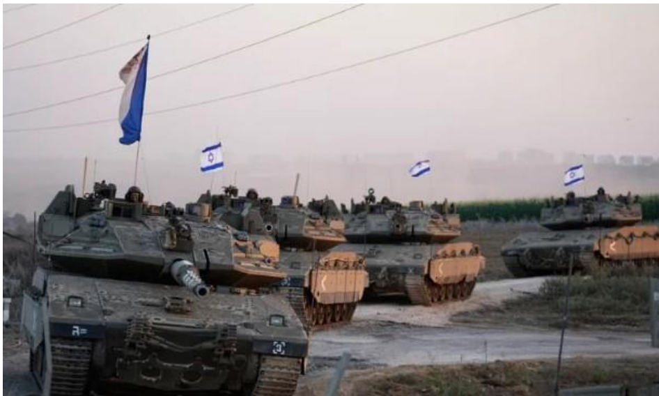
Ισραηλινά άρματα μάχης.

πλων της Δυνάμεων. Από την επομένη του παλαιστινιακού χτυπήματος ξεκίνησε την επιχείρηση «Σιδηρούν Ξίφος(Iron Sword), με τη προσβολή από αέρος κρατικών και στρατιωτικών εγκαταστάσεων. Ο Ισραηλινός στρατός απέκλεισε τη Λωρίδα της Γάζας και διέκοψε τη παροχή ηλεκτρικής ενέργειας, φυσικού αερίου, νερού και τροφίμων. Εκτιμώ ότι δεν θα υπάρξει μεγάλης κλίμακος χερσαία επιχείρηση γιατί είναι δύσκολη η ανάπτυξη στρατευμάτων σε μια ιδιαίτερα πυκνοκατοικημένη περιοχή, στην οποία η κατάσταση έχει επιδεινωθεί από τα ερείπια των κατεστραμμένων κτιρίων. Θεωρώ πιθανότερη την εκτέλεση καταδρομικής μορφής επιχειρήσεων για την απελευθέρωση των ομήρων, τη σύλληψη ηγετικών στελεχών της Χαμάς και τη καταστροφή των υπογείων στοών. Η τελευταία ασπίδα της Χαμάς είναι οι όμηροι. Ο πρωθυπουργός του Ισραήλ Μπενιαμίν Νετανιάχου[5] κάλεσε τους Παλαιστίνιους «να απομακρυνθούν από τη Γάζα γιατί θα την ισοπεδώσει». Οι απώλειες μέχρι σήμερα(14 Οκτ 10:00), ανέρχονται σε: Νεκροί: 1.300 Ισραηλινοί και 1.951 Παλαιστίνιοι, Τραυματίες: 3.400 Ισραηλινοί και 8.296 Παλαιστίνιοι, επιπλέον κρατούνται από τους Παλαιστίνιους 200 όμηροι, όχι από το Ισραήλ, αλλά από διάφορες χώρες. Από τους ισραηλινούς βομβαρδισμούς έχουν καταστραφεί περισσότερες από 22.600 κατοικίες, 19 εγκαταστάσεις υγείας και 90 σχολεία, 18 τεμένη, 70 βιομηχανικές εγκαταστάσεις(πηγή: BBC).