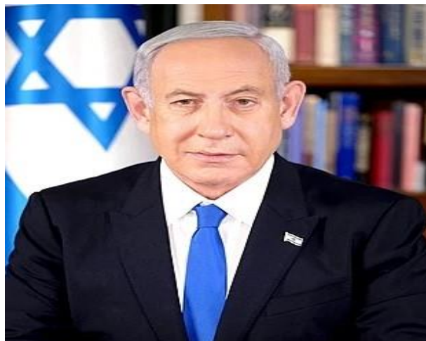
Ο Μπενιαμίν Νετανιάχου.

[5] Ο Μπενιαμίν Νετανιάχου γεννήθηκε το 1949 και είναι πρωθυπουργός του Ισραήλ από τον Δεκέμβριο του 2022. Είναι αρχηγός του συντηρητικού κόμματος Λικούντ Προηγουμένως υπηρέτησε στην πρωθυπουργία του κράτους από τον Ιούνιο του 1996 ως τον Ιούλιο του 1999 και από το 2009 έως το 2021. Είναι ο πρώτος πρωθυπουργός του Ισραήλ ο οποίος γεννήθηκε μετά την ίδρυση του κράτους το 1948.