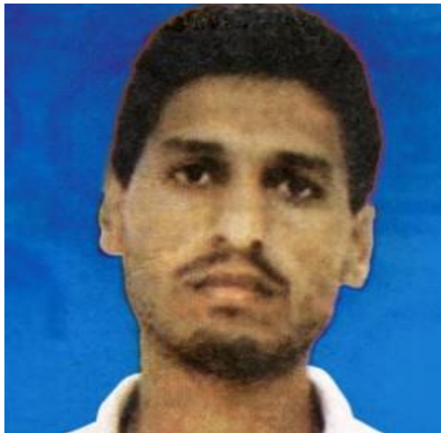
Ο Μοχάμεντ Ντεϊφ.

[1] Ο Μοχάμεντ Ντεϊφ (Mohammed Dayf) γεννήθηκε το 1965, μετά τον Αραβο-Ισραηλινό πόλεμο του 1948, στον Καταυλισμό Προσφύγων Χαν Γιούνις στη Λωρίδα της Γάζας με το επώνυμο Μάσρι (Masri). Το 1990, μετά την ένταξή του στη Χαμάς, το άλλαξε σε Ντεϊφ που σημαίνει «επισκέπτης ή φιλοξενούμενος». Έχει επιζήσει από 7 απόπειρες δολοφονίας, από τις οποίες έχασε ένα χέρι, ένα μάτι και έχει μείνει παράλυτος, όπως και όλη την οικογένειά του. Το 2015, οι ΗΠΑ τον περιέλαβαν στον κατάλογό του με τούς πλέον επικίνδυνους τρομοκράτες παγκοσμίως.