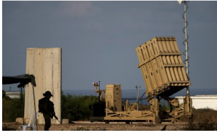
20πλός εκτοξευτής πυραύλων του Σιδηρού Θόλου.

λους Tamir, μήκους 3 μέτρων, βάρους 90 κιλών, οι οποίοι μεταφέρουν 11 κιλά εκρηκτικής ύλης και κοστίζουν 40.000 δολάρια έκαστος. Οι ΗΠΑ έχουν χρηματοδοτήσει την κατασκευή του Σιδηρού Θόλου με 2,9 δισεκατομμύρια δολάρια. Το Ισραήλ το χρησιμοποιεί από το 2011.