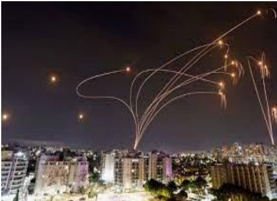
Αναχαιτήσεις ρουκετών από το "Σιδηρούν Θόλο.

Η Χαμάς αιφνιδίασε τις Ισραηλινές μυστικές υπηρεσίες [Mossad (Εξωτερική Ασφάλεια), Aman(Στρατιωτικές Πληροφορίες), Shabak (Εσωτερική Ασφάλεια)]. Οι Ισραηλινοί πρέπει να διερευνήσουν τα αίτια της απότυχίας εκτιμήσεως του μεγέθους του χτυπήματος και του χρόνου εκτέλεσης της επιχειρήσεως. Έχουν υποχρέωση να αναλύσουν επίσης, πως τους διέφυγε η τάξη τόσο μεγάλου αριθμού συστημάτων που απαιτούνται για τις χιλιάδες ρουκέτες που εκτοξεύθηκαν. Θα πρέπει επιπροσθέτως να αναζητήσουν τρόπους βελτιώσεως του συστήματος Αντιαεροπορικής Προστασίας «Σιδηρούς Θόλος[4](Iron Dome)», ώστε να δύναται να ανταποκρίνεται σε μαζικές επιθέσεις. Πρακτικά το σύστημα δεν είναι σχεδιασμένο να μπορεί να αναχαιτίζει περισσότερες από 800 ρουκέτες συγχρόνως. Το Ισραήλ διαθέτει 10 πυροβολαρχίες, εκάστη των οποίων διαθέτει 3-4 συστήματα εκτοξεύσεως 20 πυραύλων το καθένα. Την 7 η Οκτωβρίου εντός μισής ώρας εκτοξεύθηκε ο ίδιος αριθμός ρουκετών, που βλήθηκαν σε χρονικό διάστημα 50 ημερών κατά την σύγκρουση του 2014.