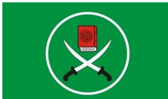
Το έμβλημα της Μουσουλμανικής Αδελφότητας.

[3] Μουσουλμανική Αδελφότητα είναι ένα σουνιτικό ισλαμικό θρησκευτικό, πολιτικό και κοινωνικό κίνημα. Υπολογίζεται ως έχει 2,5 εκατομμύρια οπαδούς. Ιδρύθηκε στην Αίγυπτο από τον Ιμάμη και δάσκαλο Χασάν Αλ Μπάννα το Μάρτιο του 1928 και έχει οπαδούς σε όλες τις μουσουλμανικές χώρες. Το πιο διάσημο σύνθημά της είναι «Το Ισλάμ είναι η λύση». Το 2013 η Αίγυπτος την έθεσε εκτός νόμου και την κήρυξε τρομοκρατική οργάνωση. Την ακολούθησαν η Σαουδική Αραβία και ΗΑΕ.