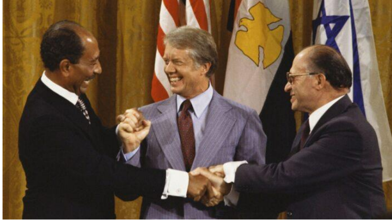
Ανουάρ Σαντάτ, Τζίμι Κάρτερ, Μεναχέμ Μπεγκίν.

Αραφάτ κατηγορήσε τον Σαντάτ ότι: «Αντάλλαξε την Ιερουσαλήμ με την έρημο του Σινά» και απείλησε τις ΗΠΑ με τρομοκρατικά χτυπήματα, ως απάντηση των αποφάσεων που ελήφθησαν στο Καμπ Ντέιβιντ.