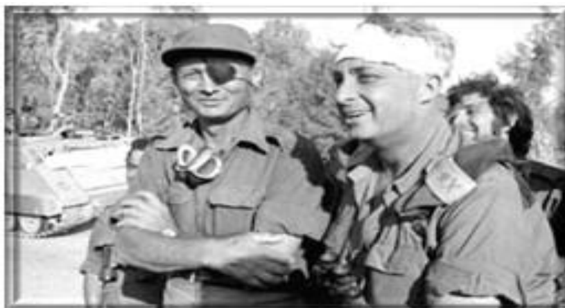
Ο Αντιστράτηγος Μοσέ Νταγιάν και ο Ταξίαρχος Αριέλ Σαρόν.

νου. Οι Ισραηλινές δυνάμεις αριθμούσαν 240.000 άνδρες, 800 άρματα μάχης και 300 αεροσκάφη. Οι αραβικές ανερχόντουσαν σε 550.000 άνδρες, 2.504 άρματα μάχης και 957 αεροσκάφη. Εντός έξι ημερών οι αραβικές δυνάμεις υπέστησαν συντριπτική ήττα, με αποτέλεσμα το Ισραήλ να καταλάβει εδάφη κατά 3,5 φορές μεγαλύτερα της συνολικής εκτάσεώς του: την χερσόνησο του Σινά και την Λωρίδα της Γάζας οι οποίες ανήκαν στην Αίγυπτο, την δυτική όχθη του Ιορδάνη ποταμού σε βάρος της Ιορδανίας και τα Συριακά υψώματα του Γκολάν. Οι απώλειες του Ισραήλ ανήλθαν σε 1.000 νεκρούς, 400 άρματα μάχης και 46 αεροσκάφη, ενώ οι αραβικές σε 23.000 νεκρούς, 6.000 αιχμαλώτους, 1.200 άρματα μάχης και 500 αεροσκάφη.