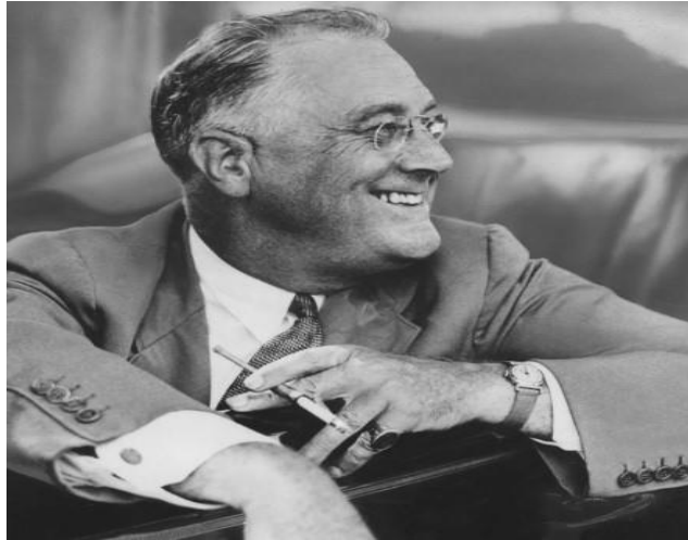
Ο Φραγκλίνος Ρούσβελτ.

επίθεση των Γερμανικών στρατευμάτων εναντίον της Γαλλίας, ανέλαβε τα καθήκοντα του πρωθυπουργού, υποσχόμενος «αἷμα, μόχθο, δάκρυα και ιδρώτα». Ο Τσώρτσιλ φάνηκε σαν να είχε προετοιμάσει όλη του την ζωή, για να ηγηθεί της Μεγάλης Βρετανίας, κατά του εχθρού που απείλησε την ύπαρξή της. Σύμφωνα με τον Άγγλο εκφωνητή Έντουαρντ Μάρροου (Edward Murrow), «Επιστράτευσε την αγγλική γλώσσα και την έστειλε στη μάχη».