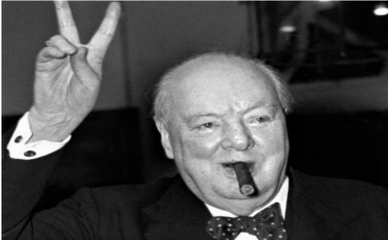
Ο Ουίνστον Τσώρτσιλ.

II. Την επίτευξη συμφωνίας για το διανομή του κόσμου. Η πατρίδα μας, όπως και τα υπόλοιπα κράτη αποτελούσαν απλές ψηφίδες ενός παγκόσμιου μωσαϊκού που το συναρμολογούσαν σύμφωνα με τα συμφέροντα τους.