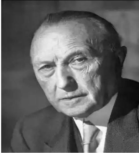
Ο Κόνραντ Αντενάουερ.