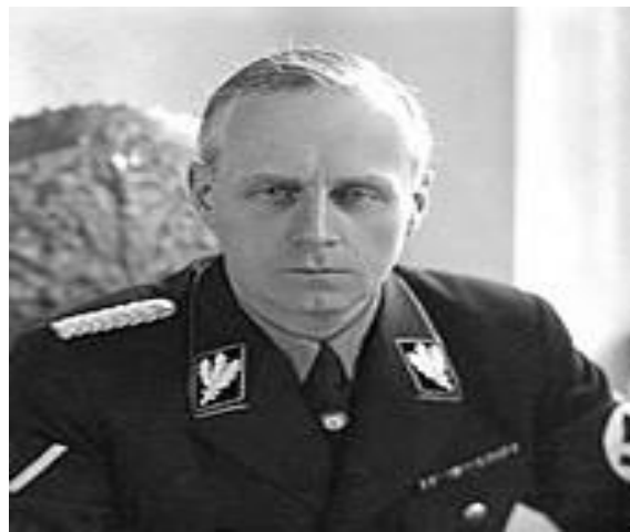
Ο Γιοάχιμ φον Ρίμπεντροπ.

[1] Ο Ούλριχ Γιοάχιμ φον Ρίμπεντροπ(1893-1946), υπήρξε υπουργός εξωτερικών της κυβερνήσεως του Αδόλφου Χίτλερ από το 1938 μέχρι το 1945. Υπήρξε ένας εκ των κατηγορούμενων στη «Δίκη της Νυρεμβέργης», κρίθηκε ένοχος και καταδικάσθηκε σε θάνατο. Απαγχονίσθηκε την 16 η Οκτωβρίου 1946.