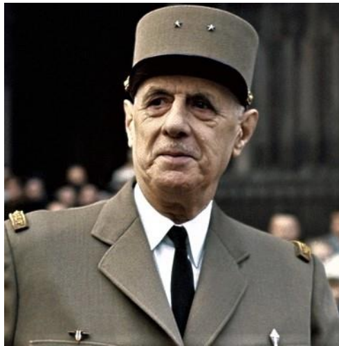
Ο Στρατηγός Σαρλ ντε Γκωλ.

[9] Ο Γάλλος Στρατηγός Σαρλ ντε Γκωλ (1890-1970), αποφοίτησε από την Στρατιωτική Σχολή του Σαιν-Σιρ με το βαθμό του Ανθυπολοχαγού και πολέμησε κατά τον Α΄ΠΠ. Το Β΄ΠΠ δεν αποδέχθηκε την ανακωχή της πατρίδας του με τη Γερμανία, διέφυγε στο εξωτερικό και ηγήθηκε της γαλλικής αντιστάσεως. Διετέλεσε πρόεδρος της Γαλλίας από το 1944 έως το 1946 και από το 1958 έως το 1969. Αποτελεί κορυφαία πολιτική φυσιογνωμία της μεταπολιτικής Γαλλίας, δίνοντας στην ιδεολογία του το όνομα του(Γκωλισμός).