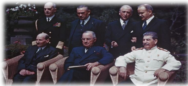
Ο Κλήμεντ Άτλη, ο Χάρρυ Τρούμαν και ο Ιωσήφ Στάλιν στο Πότσονταμ.

Από την 17 η Ιουλίου έως την 2 α Αυγούστου του 1945, στο ανάκτορο Σεσίλιενχοφ (Seciliehhof) στο Πότσονταμ[Potsdam (20 χλμ ΝΔ του Βερολίνου)], ήταν η τελευταία φορά που βρέθηκαν στο ίδιο τραπέζι, ο αρχηγός της Σοβιετικής Ενώσεως Ιωσήφ Στάλιν, ο πρωθυπουργός του Ηνωμένου Βασιλείου Ουίνστον Τσώρτσιλ και ο πρόεδρος των ΗΠΑ Χάρρυ Τρούμαν. Ο Τσώρτσιλ αποχώρησε από την διάσκεψη, πριν την λήξη της, και την θέση του έλαβε ο νικητής των βρετανικών εκλογών Κλήμεντ Άτλη [7]. Ο Τρούμαν είχε διαδεχθεί τον Φραγκλίνο Ρούσβελτ την 8 η Απριλίου του 1945, μετά τον θάνατο του από εγκεφαλική αιμορραγία. Η άνευ όρων παράδοση της Γερμανίας την 8 η Μαΐου 1945, εξάλειψε τον λόγο υπάρξεως της συμμαχίας, ενώ σηματοδότησε μια 50χρονη περίοδο αντιπαλότητας των δύο υπερδυνάμεων, η οποία έμεινε στην ιστορία ως ψυχρός πόλεμος. Κατά την διάρκεια της διασκέψεως οι ΗΠΑ έκαναν την πρώτη επιτυχημένη πυρηνική δοκιμή. Ο Τρούμαν αποφάσισε την χρήση της ατομικής βόμβας προκειμένου να επιτύχει την άνευ όρων παράδοση της Ιαπωνίας. Η βουλιμία του Στάλιν ώθησε τις ΗΠΑ στην παροχή μεγάλης οικονομικής βοήθειας σ' όλες τις χώρες της Δυτικής Ευρώπης, γνωστής ως Σχέδιο Μάρσαλ.