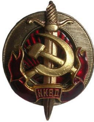
Το σήμα της ΝΚΔΥ.

[7] Ο Κλέμεντ Άτλι (Clement Atlee 1893-1967), διετέλεσε Πρωθυπουργός του Ηνωμένου Βασιλείου από το 1945 έως το 1951 και ηγήθηκε του εργατικού κόμματος επί μία εικοσαετία (1935-1955). Ο Τσώρτσιλ όταν ο Άτλι, κέρδισε τις εκλογές δήλωσε: «Είναι ένας άνθρωπος μετριοφρονών και έχει κάθε λόγο για να είναι».