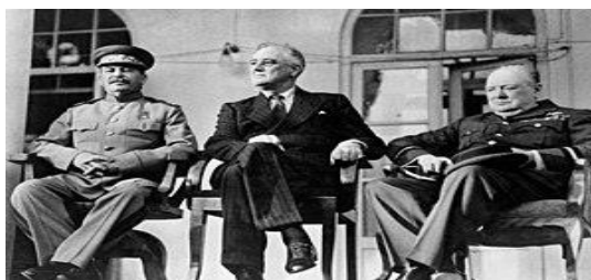
Η Διάσκεψη της Τεχεράνης.

Από τις 28 Νοεμβρίου ημέρα Κυριακή έως την 1η Δεκεμβρίου του 1943, οι τρεις ηγέτες συναντήθηκαν για πρώτη φορά στη πρωτεύουσα του Ιράν. Στη Διάσκεψη της Τεχεράνης δόθηκε η κωδική ονομασία EUREKA (σημαίνει «Εύρηκα»). Οι συναντήσεις πραγματοποιήθηκαν στη Πρεσβεία της Σοβιετικής Ενώσεως, η οποία κρίθηκε η πλέον κατάλληλη και ασφαλής. Σε κάθε γωνιά της υπήρχαν άνδρες της ασφάλειας και μικρόφωνα. Σ΄ αυτή διέμενε ο Στάλιν, αλλά και ο Ρούσβελτ στο οποίο διατέθηκε ένα εκ των οικημάτων της, ενώ ο Τσώρτσιλ εγκαταστάθηκε στη Βρετανική Πρεσβεία. Στις συναντήσεις συμφώνησαν να προεδρεύει ο Ρούσβελτ. Το «αντικείμενο του πόθου» για τον Αμερικανό Προέδρο ήταν να κερδίσει την εμπιστοσύνη του παθολογικά καχύποπτου προς τους πάντες Στάλιν, με σκοπό η ΕΣΣΔ να ενταχθεί στη παγκόσμιο κοινότητα, χωρίς να αισθάνεται ότι οι ΗΠΑ και η Μεγάλη Βρετανία είχαν συμμαχήσει εναντίον της.