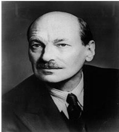
Ο Κλέμεντ Άτλι.

[7] Ο Κλέμεντ Άτλι (Clement Atlee 1893-1967), διετέλεσε Πρωθυπουργός του Ηνωμένου Βασιλείου από το 1945 έως το 1951 και ηγήθηκε του εργατικού κόμματος επί μία εικοσαετία (1935-1955). Ο Τσώρτσιλ όταν ο Άτλι, κέρδισε τις εκλογές δήλωσε: «Είναι ένας άνθρωπος μετριοφρονών και έχει κάθε λόγο για να είναι».