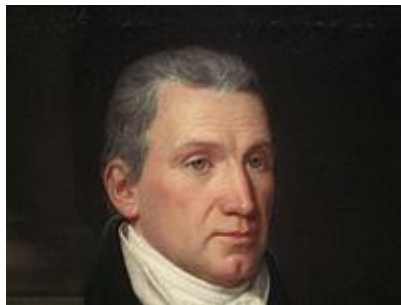
Ο 5 ος Πρόεδρος των ΗΠΑ Τζέιμς Μονρόε

Η κίνηση αυτή οδήγησε τον 5 ο Πρόεδρο των ΗΠΑ Τζέιμς Μονρόε το Δεκέμβριο του 1822 να περιλάβει στο προσχέδιο του Διαγγέλματος, που έμεινε γνωστό στην ιστορία ως «Δόγμα Μονρόε», πρόταση για την αποστολή πρεσβευτού στην Ελλάδα, με το σκεπτικό ότι είχε ήδη δημιουργηθεί κυρίαρχη ελληνική επικράτεια. Τελικά δεν την περιέλαβε στο κείμενο ως αντίθετη προς το πνεύμα και το περιεχόμενο του. Ωστόσο η πρότασή του υπήρξε η πρώτη ευμενής εκδήλωση από ένα ισχυρό κράτος για την αναγνώριση του αγώνος των Ελλήνων.