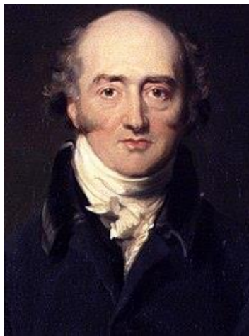
Γεώργιος Κάννιγκ (1770-1827), Πρωθυπουργός Ην. Βασιλείου 12 Απρ 1827 – 8 Αυγ 1827. Υπουργός Εξωτ. 1822-1827.

Ο Γεώργιος Δ΄. Ενθρονίσθηκε το 1820, σε ηλικία 57 χρονών, και διετέλεσε βασιλεύς της Μεγάλης Βρετανίας καθ' όλη την διάρκεια της επαναστάσεως. Αντιμετώπιζε σοβαρά προβλήματα υγείας και δεν ενδιαφερόταν ιδιαίτερα για θέματα εξωτερικής πολιτικής. Ο Πρωθυπουργός του βασιλείου Ρόμπερτ Τζένκινσον, από το 1812 έως το 1827, εμπιστεύθηκε τον χειρισμό του ελληνικού ζητήματος στον Γεώργιο Κάννιγκ, ο οποίος διατήρησε την θέση του υπουργού εξωτερικών από το 1822 έως το 1827.