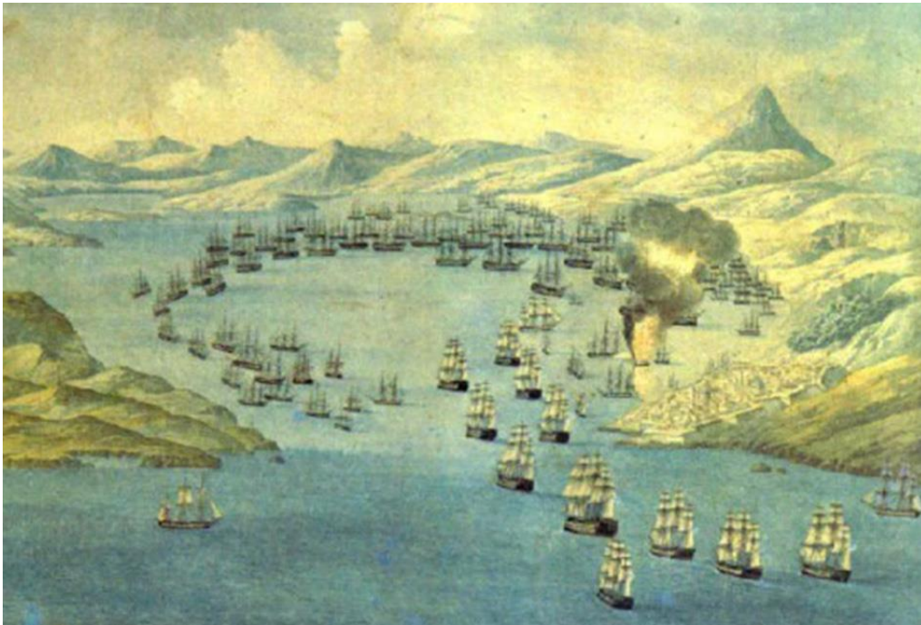
Η Ναυμαχία του Ναβαρίνου

Τις κρίσιμες εκείνες στιγμές για την πατρίδα μας η κατάσταση που επικρατούσε στο Ναύπλιο, θύμιζε «Την Άγρια Δύση της Αμερικής». Δεν ανταλλάσσονταν απλώς πυροβολισμοί, αλλά κανονιοβολισμοί μεταξύ τριών «καπεταναίων». Από το Παλαμήδι που κατείχε ο αυτόκλητος φρούραρχος και δυνάστης της πόλεως Θεόδωρος Γρίβας και από την Ακροναυπλία στην οποία έδρευε ο διορισμένος από την κυβέρνηση φρούραρχος Νάσος Φωτομάρας με τον Ιωάννη Στράτο. Τα θύματα μεταξύ των τρομοκρατημένων κατοίκων Ελλήνων και ξένων υπήρξαν πολλά. Με ενέργειες σαν και αυτές δεν πρέπει να αναρωτιόμαστε για τον τρόπο που μας αντιμετώπιζαν οι ξένοι.