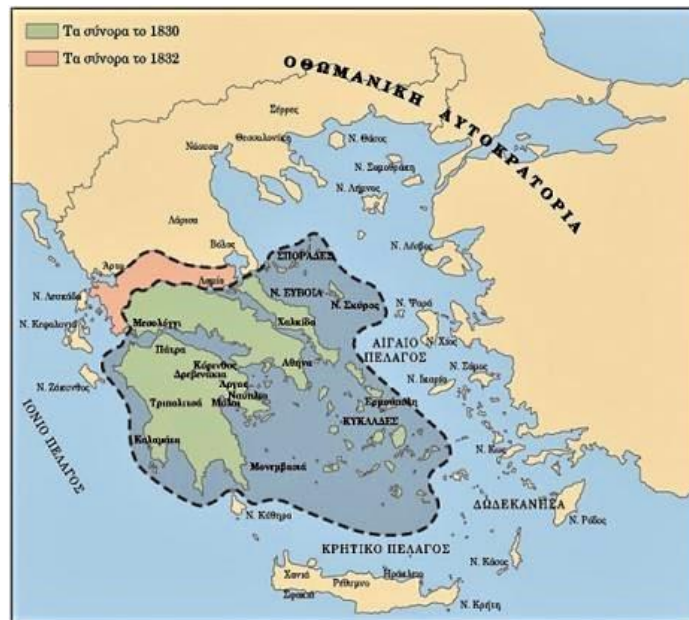
Τα τελικά όρια του νέου Ελληνικού κράτους (1832).

Η Τουρκία δεν αποδέχθηκε τη συνθήκη του Λονδίνου, παρά την καταστροφή του στόλου της και την άφιξη του γαλλικού στρατού στην Πελοπόννησο. Την 14 η Σεπτεμβρίου 1829, αναγνώρισε τελικά την ανεξαρτησία της Ελλάδος, με την υπογραφή της «Συνθήκης της Αδριανουπόλεως» (Άρθρο 10), η οποία σήμανε τον τερματισμό του Ρωσο-τουρκικού πολέμου, που ξέσπασε το 1828. Η Υψηλή Πύλη [1] εκτός από την Συνθήκη του Λονδίνου του 1827, αποδέχθηκε και το Πρωτόκολλο του Λονδίνου της 22 ας Μαρτίου 1829, που καθόριζε ως βόρεια σύνορα της χώρας την γραμμή Παγασητικού-Αμβρακικού. Η γραμμή αυτή οριστικοποιήθηκε με το Πρωτόκολλο του Λονδίνου της 30 ης Αυγούστου 1832.