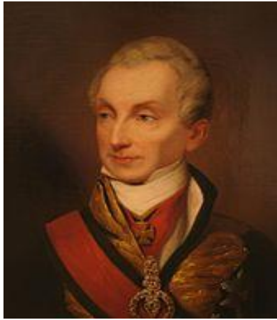
Κλέμενς Φον Μέττερνιχ (1773-1859), Υπουργός Εξωτερικών της Αυστρο-ουγγρικής αυτοκρατορίας (1818-1848).

ρωσική επιρροή. Το όνομά του παρέμεινε στην ιστορία ως συνώνυμο του «ανθελληνισμού».