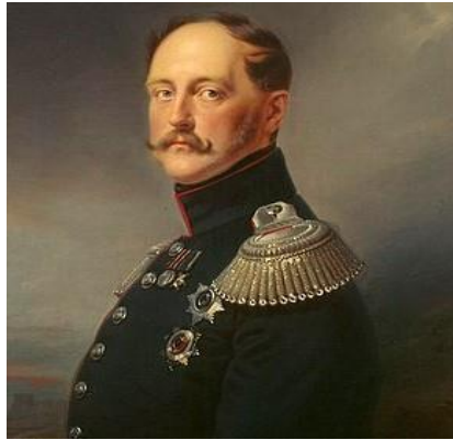
Νικόλαος Α΄ (1796-1855), Τσάρος της Ρωσίας 1825-1855.

Ο Νικόλαος Α΄ κυβέρνησε από το 1825 έως το 1855, επεδίωξε να αναχαιτίσει την επέκταση της Μεγάλης Βρετανίας και της Γαλλίας στην Ανατολική Μεσόγειο. Στήριξε την πολιτική του στην υπεράσπιση της ορθοδοξίας, στην απόκτηση της αυτονομίας των υποτελών στην Τουρκία Βαλκανικών λαών και στην καταπολέμηση του Ισλάμ. Αποφάσισε να συμμετάσχει η χώρα του στην ναυμαχία του Ναβαρίνου και κήρυξε τον πόλεμο κατά της Τουρκίας το 1828.