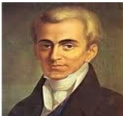
Υπουργός Εξωτερικών Ρωσίας: 1815-1822, Κυβερνήτης Ελλάδος: 18 Ιαν 1828-27 Σεπ 1831.

Ο Ιωάννης Καποδίστριας απολάμβανε της εμπιστοσύνης του Τσάρου Αλέξανδρου Α΄ και διετέλεσε Υπουργός Εξωτερικών του από το 1815 έως το 1822. Δέχθηκε κριτική για την μη αποδοχή της αρχηγίας της Φιλικής Εταιρείας και την αποκήρυξη του Αλέξανδρου Υψηλάντη. Οι ενέργειες αυτές ήσαν ασυμβίβαστες με το αξίωμα που κατείχε. Στην συνέχεια όταν αποδέχθηκε την θέση του πρώτου κυβερνήτου της Ελλάδος, υπερασπίσθηκε τα ελληνικά συμφέροντα και μόνο. Αρνήθηκε να λάβει την σύνταξη που του παρείχε ο Τσάρος, για να δείξει ότι ήταν πλήρως αδέσμευτος, αλλά και ως κυβερνήτης δεν έλαβε ποτέ μισθό από το δημόσιο ταμείο.