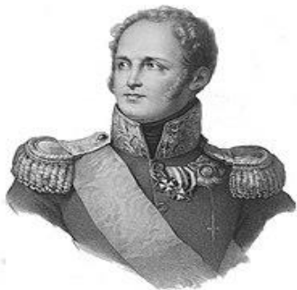
Ο Αλέξανδρος Α΄ Παύλοβιτς (1777-1825) Τσάρος της Ρωσίας(1801-1825).

Ο Αλέξανδρος Α΄, κυβέρνησε από το 1801 έως το 1825. Υπήρξε μία από τις σημαντικότερες προσωπικότητες που συνέβαλλαν στην τελική ήττα του Ναπολέοντος. Η Ιερά Συμμαχία ιδρύθηκε μετά από δική του πρωτοβουλία. Κατά την διάρκεια του συνεδρίου του Λάϋμπαχ, πληροφορήθηκε την έναρξη της Επανάστασεως από τον Αλέξανδρο Υψηλάντη. Αυτό είχε ως αποτέλεσμα να τον διαγράψει από τον Ρωσικό στρατό, ενώ διέταξε τον Υπουργό Εξωτερικών του Ιωάννη Καποδίστρια, να τον ενημερώσει εγγράφως για την αποκήρυξη της ενέργειάς του. Στη Βερόνα, με δική του εντολή δεν έγινε αποδεκτό το αίτημα της ελληνικής αντιπροσωπείας να παρουσιασθεί στο συνέδριο. Ο Μέττερνιχ τον επηρέαζε σε μεγάλο βαθμό και τον χαρακτήριζε «ως τρελό τον οποίο πρέπει να τον αντιμετωπίζεις με χιούμορ», ενώ οι Βρεττανοί τον θεωρούσαν μυστικοπαθή και καχύποπτο.