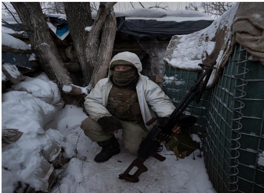
Αντιστράτηγος ε.α. Ιωάννης Κρασσάς.

ένα στρατιώτη στο χαράκωμα, η εμπνευσμένη ηγεσία όμως είναι αυτή που θα του εμφυσήσει το πνεύμα της θυσίας. Το μεγαλείο δεν προέρχεται από το αξίωμα, αλλά από τρόπο άσκησης της εξουσίας. Μετά τον τερματισμό των εχθροπραξιών, θα διατυπωθούν οι πιο απίθανες θεωρίες συνομωσίας, ενώ οι γεωστρατηγικοί ειδήμονες θα αναλύσουν την νέα κατάσταση, όπως διαμορφώθηκε μετά τη στρατιωτική επιτυχία. Θα πρέπει να έχουμε πάντοτε κατά νου ότι, η κατάκτηση της νίκης είναι το επακόλουθο της αδάμαστης θελήσεως εκείνων των ξεχωριστών ανθρώπων, που η αγάπη τους για τη πατρίδα τους κρατάει ζεστούς έστω και αν κοιμούνται πάνω στα χιόνια.