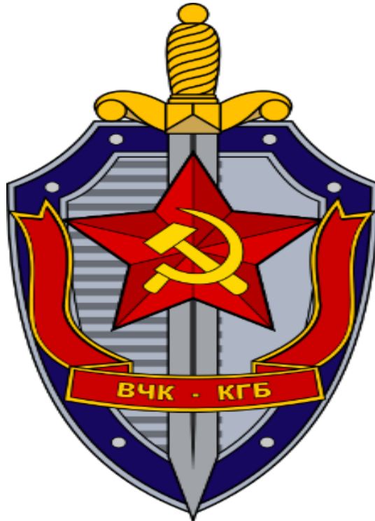
Το Έμβλημα της Κα Γκε Μπε.

κής Ενώσεως ως κατεξοχήν υπηρεσία ασφαλείας, συλλογής πληροφοριών και μυστικής αστυνομίας, από το 1954 έως το 1991. Το Δεκέμβριο του 1995, ο Πρόεδρος της Ρωσίας Μπόρις Γιέλτσιν υπέγραψε την πράξη που καταργούσε τη ΚGB, που έκτοτε υποκαταστάθηκε από την FSB, τη σημερινή εσωτερική κρατική υπηρεσία ασφαλείας της Ρωσικής Ομοσπονδίας. Στη Λευκορωσία το επίσημο όνομα της Κρατικής Υπηρεσίας Ασφαλείας παραμένει Κ.Γ.Β.