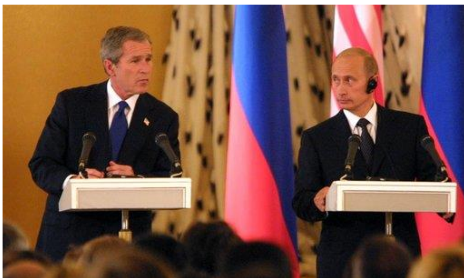
Αυτό που είδε ο Μπάιντεν.

Ο Βλαντίμιρ Πούτιν επιλέχθηκε από τον Πρόεδρο της Ρωσίας Μπόρις Γιέλτσιν [1] , ως Υπηρεσιακός Πρωθυπουργός επί Προεδρίας Μπιλ Κλίντον [2] . Ο έμπειρος Αμερικανός Πρόεδρος είπε στο Γιέλτσιν, ότι ευνοούμενός του δεν δείχνει να έχει δημοκρατική συνείδηση. Ο πρώην πράκτορας της Κα Γκε Μπε [3] , με μοναδική πολιτική εμπειρία την θητεία του στο Δημοτικό Συμβούλιο της Αγίας Πετρούπολης και στο Εκτελεστικό Γραφείο του Ρώσου Προέδρου, ήταν δύσκολο να παρουσιάσει κάτι διαφορετικό απ' αυτό που πράγματι ήταν. Οι Ρώσοι δεν βίωσαν ποτέ τα πολιτικά δικαιώματα των δυτικών δημοκρατιών και δεν δύνανται να κατανοήσουν τα κεκτημένα των πολιτών τους. Ο Πούτιν πρότεινε στον πρόεδρο των ΗΠΑ Μπιλ Κλίντον τη ένταξη της χώρας του στο ΝΑΤΟ [4] . Το 2001, ο επόμενος Πρόεδρος των ΗΠΑ Τζώρτζ Μπους [5] , μετά την πρώτη συνάντησή τους δήλωσε: «Τον κοίταξα στα μάτια και μπόρεσα να αντιληφθώ μια αίσθηση της ψυχής του». Το σίγουρο είναι ότι ο Μπους δεν κατάλαβε ποτέ τι ήταν αυτό που είδε. Ο Πούτιν όμως σίγουρα τον ξεγέλασε σχετικά με τον χαρακτήρα του και αντελήφθη ότι μπορεί να εκμεταλλευθεί τις αδυναμίες του αμερικανικού συστήματος. Η ένταξη των περισσότερων πρώην ανατολικοευρωπαϊκών χωρών στο ΝΑΤΟ και οι πόλεμοι του Μπους εναντίον του Ιράκ και του Αφγανιστάν τόν έπεισαν ότι η επέκταση της κυριαρχίας των ΗΠΑ, αποτελεί απειλή κατά της Ρωσίας. Το 2008 ο Μπους δεν αντιτάχθηκε στην ανεξαρτητοποίηση των επαρχιών Οσετίας και Απχαζίας της πρώην Σοβιετικής Δημοκρατίας της Γεωργίας.