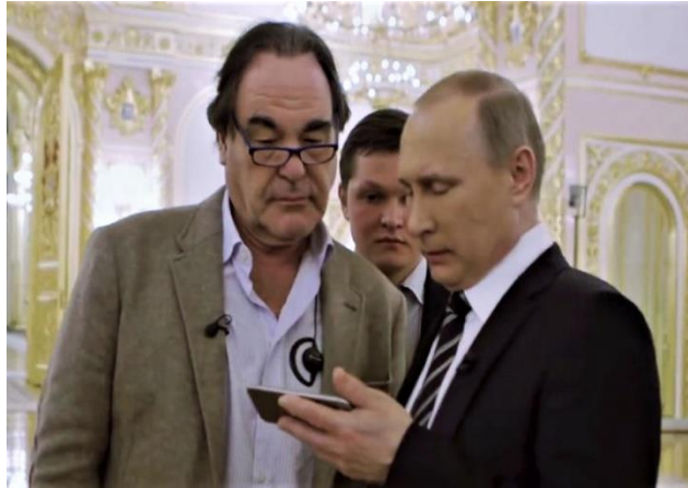
Πούτιν και Όλιβερ Στόουν.

[5] Ο Τζορτζ Μπους George [Walker Bush(1946-)] διετέλεσε 43 ος Πρόεδρος των ΗΠΑ από το 2001 έως το 2009. Είναι μέλος του Ρεπουμπλικανικού κόμματος Προηγούμενος, είχε υπηρετήσει ως 46ος κυβερνήτης του Τέξας από το 1995 έως το 2000.