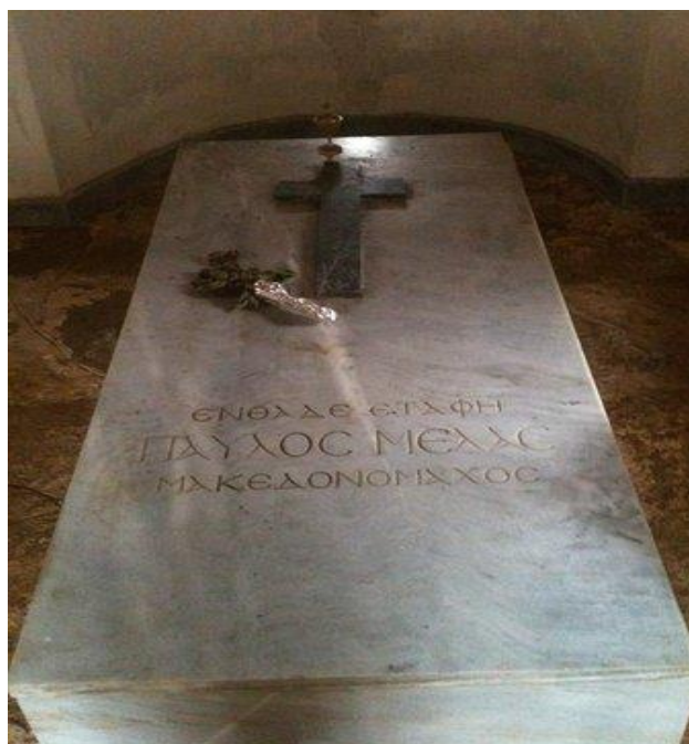
Ο τάφος του Παύλου Μελά.

Μοναστήρι) και απέστειλε αξιωματικούς για την οργάνωση και εξύψωση του ηθικού των ομοεθνών μας. Το 1904 αποφάσισε την ενίσχυση του αγώνα με ένοπλα τμήματα εθελοντών με επικεφαλής αξιωματικούς. Την 28 η Αυγ. 1904 (παλ.ημ.) ο Παύλος Μελάς ήταν από τους πρώτους που πέρασε τα σύνορα, ως καπετάνιος «Μίκης Ζέζας». Σύντομα το σώμα του έφθασε τους 70 άνδρες και η παρουσία του στα χωριά της Δ. Μακεδονίας απέδωσε τα αναμενόμενα. Το ηθικό των κατοίκων ανέβηκε κατακόρυφα, ενώ πολλοί δήλωσαν την επιθυμία να πολεμήσουν, για να υπερασπιστούν την ελληνικότητα της Μακεδονίας. Την 12 η Οκτ. 1904, ο Παύλος Μελάς μ' ένα μέρος από το τμήμα του, μετά από μια δυνατή νεροποντή, βρήκαν φιλοξενία στο χωριό Στάτιστα. Την επομένη άνδρες του Παύλου Μελά συνεπλάκησαν με τουρκικό απόσπασμα, το οποίο εμφανίσθηκε στο χωριό ειδοποιημένο από τον Βούλγαρο κομιτατζή Μήτρο Βλάχο. Το ίδιο βράδυ ο Μελάς πυροβολήθηκε ευρισκόμενος στην αυλή του σπιτιού και μετά από μισή ώρα εξέπνευσε. Για τον θάνατο του έχουν διατυπωθεί διάφορες θεωρίες χωρίς όμως τεκμηρίωση. Το κεφάλι του ήρωος για να μην αναγνωρισθεί η ταυτότητα του Παύλου Μελά από τους Τούρκους, έκοψε ο πιστός του σύντροφος Ντίνας Στεργίου και το ενταφίασε μπροστά στην Ωραία Πύλη του ναού της Αγίας Παρασκευής στο Πισοδέρι. Ο Μητροπολίτης Καστοριάς Γερμανός Καραβαγέλλης έθαψε το ακέφαλο σώμα στο παρεκκλήσιο των Ταξιαρχών, πλησίον της Μητροπολιτικού μεγάρου Καστοριάς. Ο τάφος του Παύλου Μελά σήμερα βρίσκεται στην Καστοριά.