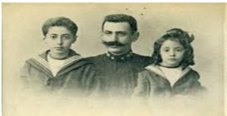
Ο Παύλος Μελάς με τα παιδιά του.

Τις νυκτερινές ὥρες τῆς 13 ης Οκτωβρίου τοῦ 1904(παλ. ημ.), ὁ Ανθυπολοχαγὸς Πυροβολικοῦ Παῦλος Μελάς, σε ηλικία 34 χρονῶν, ἀφήσε τὴν τελευταία τοῦ πνοή στη Στάτιστα (σημερινὸς Μελάς) τῆς Μακεδονίας. Ὁ θάνατος τοῦ προήλθε ἀπὸ θανάσιμο τραυματισμὸ στην οσφυϊκὴ χώρα, συνεπεία πυροβολισμοῦ, μετὰ ἀπὸ συμπλοκὴ με τουρκικὸ στρατιωτικὸ ἀπόσπασμα. Τόσον ὁ Μελάς, ὅσο καὶ ἡ σύζυγός τοῦ Ναταλία (θυγατέρα τοῦ Στέφανου Δραγούμη [1] ), προέρχονταν ἀπὸ ἐπιφανεῖς καὶ εὐπορες οἰκογένειες. Ἀπὸ τὸ γάμο τοῦ ὁ Μελάς ἀπέκτησε δύο τέκνα τὸν Μιχάλη(Μίκης) καὶ τὴν Ζωή(Ζέζα).