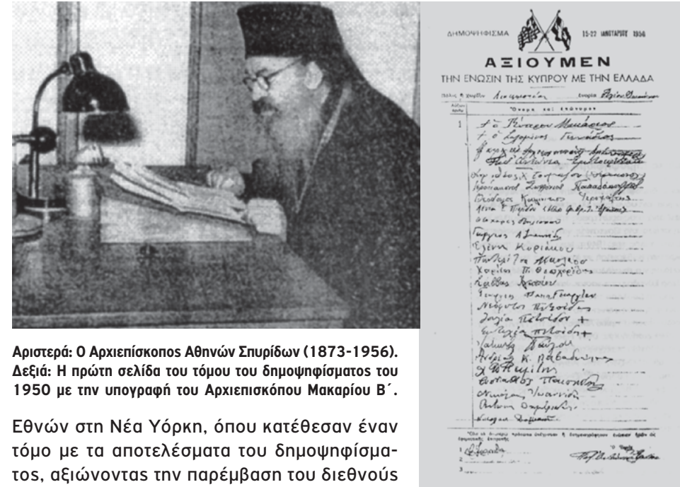
Αριστερά: Ο Αρχιεπίσκοπος Αθηνών Σπυρίδων (1873-1956). Δεξιά: Η πρώτη σελίδα του τόμου του δημοψηφίσματος του 1950 με την υπογραφή του Αρχιεπισκόπου Μακαρίου Β΄.

Εθνών στη Νέα Υόρκη, όπου κατέθεσαν έναν τόμο με τα αποτελέσματα του δημοψηφίσματος, αξιώνοντας την παρέμβαση του διεθνούς οργανισμού προς εφαρμογή της αρχής της αυτοδιαθέσεως, την 26η Σεπτεμβρίου. 12 Εν τω μεταξύ, είχε αποβιώσει ο Αρχιεπίσκοπος (την 28η Ιουνίου) και είχε τεθεί θέμα εκλογής του διαδόχου του. Την 20ή Οκτωβρίου, εξελέγη ο Μητροπολίτης Κιτίου Μακάριος (το κοσμικό όνομα του οποίου ήταν Μιχαήλ Μούσκος). 13 Η ιστορία της εισερχόταν εκ νέου σε μία νέα περίοδο...