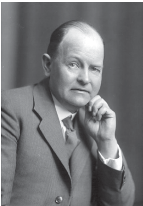
Ο Υπουργός Αποικιών Τζωρτζ Χωλ (1881-1965), ο οποίος αντιτάχθηκε με πάθος στην Ένωση.

ότι ο Υπουργός Αποικιών, Τζωρτζ Χωλ (George Henry Hall, 1st Viscount Hall), δεν έμεινε ικανοποιημένος από την εξέλιξη αυτή, αλλά επέμενε για την έκδοση μίας επίσημης ανακοίνωσης. Ο Μπέβιν, όμως, δεν έδωσε τη συγκατάθεσή του κατά τη δεδομένη χρονική στιγμή. Ο Χωλ δεν κάμφθηκε και επανήλθε τόσο τα Χριστούγεννα όσο και τουλάχιστον άλλες τρεις φορές εντός του 1946. Εντούτοις, πάντοτε αντιμετώπιζε την αντίδραση του Υπουργού Εξωτερικών, ο οποίος επ' ουδενί λόγω ήθελε τη διατάραξη των ελληνοβρετανικών σχέσεων, κατά τη δεδομένη χρονική στιγμή, καθώς στην Ελλάδα εντεινόταν η δράση της Αριστεράς, μέσω του αυτοαποκαλούμενου «Δημοκρατικού Στρατού».