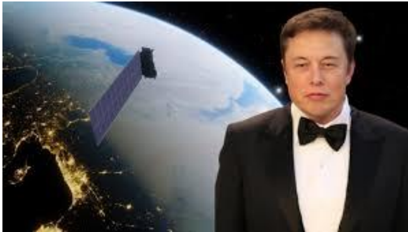
Ο Έλον Μάσκ.

Σημαντική ήταν η βοήθεια από τον Αμερικανό δισεκατομμυριούχο Έλον Μάσκ, οποίος ενεργοποίησε τους δορυφόρους Starlink και δώρισε στην Ουκρανία χιλιάδες τερματικά, ώστε η χώρα να συνεχίσει να έχει δίκτυο επικοινωνιών, μετά την καταστροφή του υπάρχοντος από τους Ρώσους κατά την έναρξη του πολέμου.