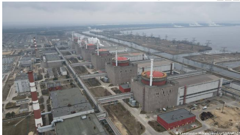
Ο σταθμός πυρηνικής ενέργειας της Zaporizhzhia( Ζαπορίζια).