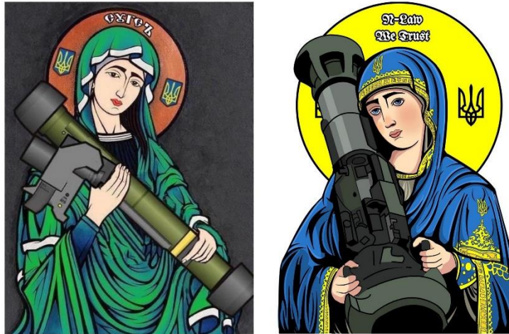
Οι Ουκρανοί απεικόνισαν την Παναγία με το αντιαρματικό FGM-148 Javelin(ακόντιο).

Προς το παρόν οι εμπόλεμοι δεν επιθυμούν να προκαλέσουν ένα ατύχημα σε κάποιο πυρηνικό σε κάποιο σταθμό πυρηνικής ενέργειας και ειδικότερα σ' αυτόν της Zaporizhzhia( Ζαπορίζια[6]), οποίος είναι ο μεγαλύτερος της Ευρώπης. Η Χρήση πυρηνικών ή χημικών όπλων, θα προκαλέσει την συμμετοχή και άλλων χωρών, με απρόβλεπτες συνέπειες.