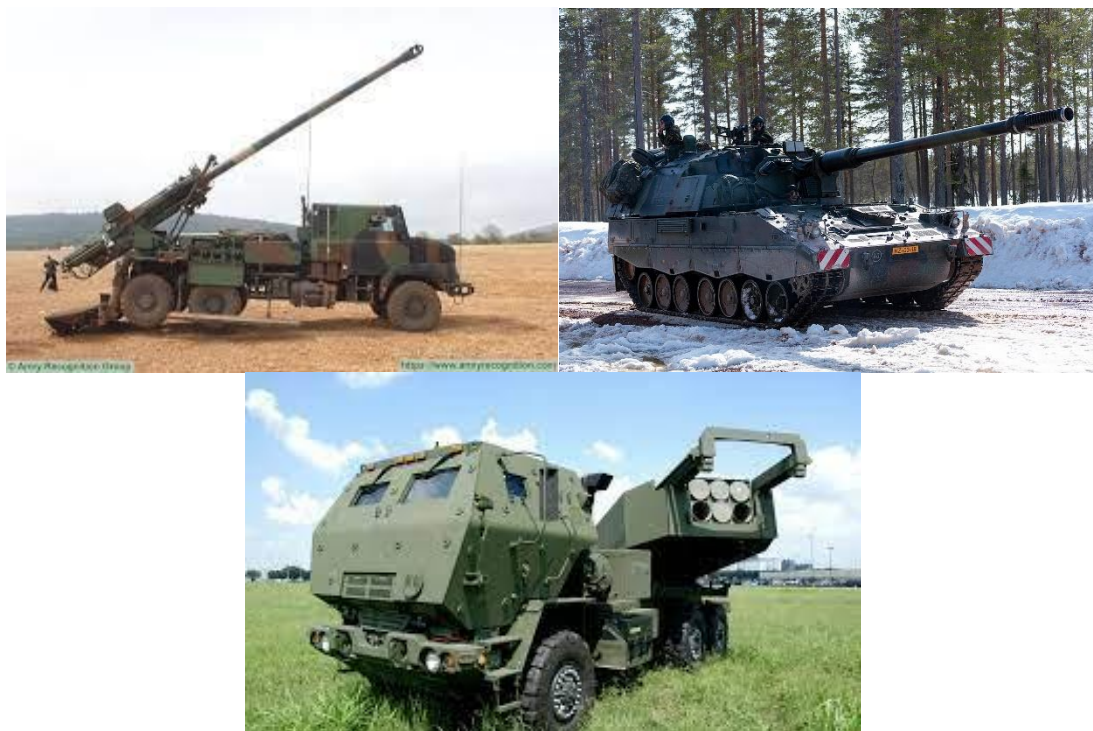
Το CAESAR από την Γαλλία. Το PzH 2000 από την Γερμανία και Το HIMARS από τις ΗΠΑ.

Ο ουκρανικός στρατός μέχρι στιγμής έχει λάβει δώδεκα HIMARS (High Mobility Artillery Rocket Systems, Υψηλής Κινητικότητα Πυραυλικά Συστήματα Πυροβολικού) και 12 συστήματα M270 MLRS( Multiple Launch Rocket System, Πολλαπλοί Εκτοξευτές Ρουκετών). Τα έχει ήδη χρησιμοποιήσει για την προσβολή αποθηκών πυρομαχικών και καυσίμων, καθώς επίσης για την καταστροφή της μεγαλύτερης οδικής γέφυρας στο ποταμό Δνείπερο (Antonviskiy Bridge).