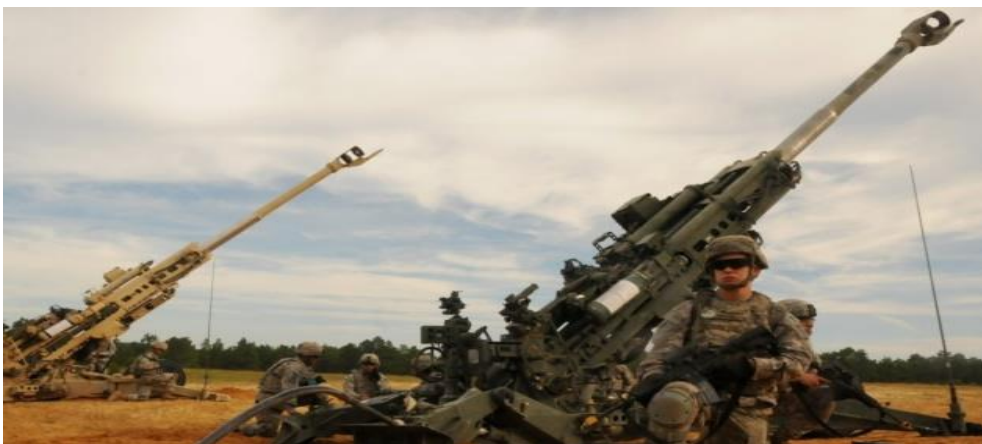
Το M777, το αμερικανικό πυροβόλο των 155 χιλ, έχει αναδειχθεί σε πρωταγωνιστή του πολέμου.

Η κατάσταση που έχει διαμορφωθεί είναι το αποτέλεσμα σκληρών μαχών, στις οποίες κυρίαρχο ρόλο διαδραματίζει το πυροβολικό και η εκτεταμένη χρησιμοποίηση των Drones. Υπολογίζεται ότι από πλευράς επιτιθεμένων έχουν ριχθεί περισσότερα από τρία εκατομμύρια βλήματα πυροβολικού, χωρίς να υπολογίζονται οι ρουκέτες και οι πύραυλοι, ενώ από τους αμυνόμενους 900.000. Το ουκρανικό πυροβολικό, την περίοδο Μαΐου-Ιουνίου 2022, στις μάχες του Kramatorsk (Κραματόρσκ) και Sloviansk (Σλοβιάνσκ) της επαρχίας (Λουγκάνσκ), κατανάλωσε σε 20 ημέρες την ετήσια παραγωγή των ΗΠΑ σε βλήματα 155 χιλ. (Οι αριθμοί υπολογίζονται κατά εκτίμηση, προερχόμενοι από διάφορες πηγές).