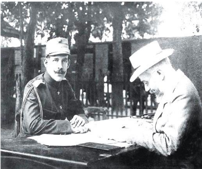
Ο Κωνσταντίνος και ο Βενιζέλος στο ΣΣ Βυρώνειας.

Την 29 η Ιουν/12 η Ιουλ ο Ελληνικός Στρατός εισήλθε στην πυρπολημένη πόλη των Σερρών, όπου πλήθος πολιτών κάθε ηλικίας και φύλου βρέθηκαν δολοφονημένοι. Τόσο η Ρωσία, όσο και η Αυστροουγγαρία άρχισαν να πιέζουν την Ελλάδα να ανακόψει την προέλασή της.