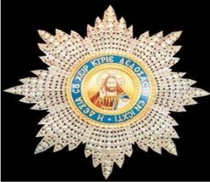
Ο Μεγαλόσταυρος του Σωτήρος.

μας στο διηνεκές. Το αίμα των πεσόντων δεν χύθηκε μάταια. Τότε « Εμεγαλύνθη η Ελλάς »