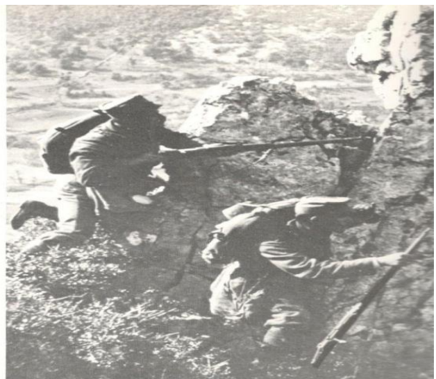
Σιμιτλί(Η τελευταία μάχη).