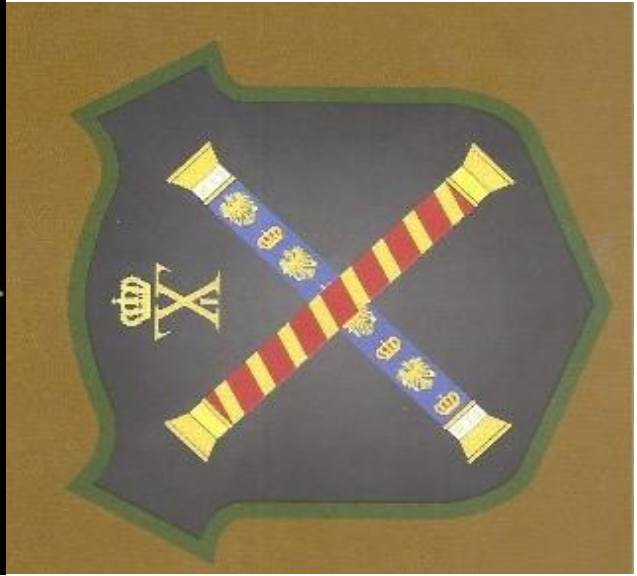
Οι Στραταρχικές ράβδοι του Κωνσταντίνου. ( Κόκκινη η Ελληνική, Γαλάζια η Γερμανική )