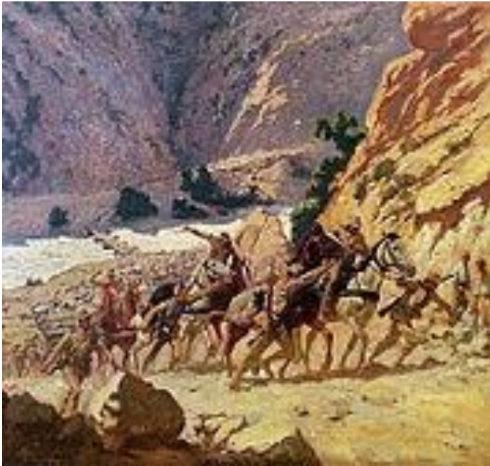
Στα Στενά της Κρέσνας.

και εις βάρος της Ελλάδος για την Θεσσαλονίκη. Οι τρεις χώρες δεν δεσμεύονταν με καμμία συμφωνία. Η Ρουμανία στράφηκε επίσης κατά της Βουλγαρίας διεκδικώντας την περιοχή της Δοβρουτσάς [2]. Η Τουρκία εκμεταλλεύτηκε την εξέλιξη των επιχειρήσεων, κήρυξε τον πόλεμο κατά της Βουλγαρίας και ανέκτησε το μεγαλύτερο μέρος της Ανατολικής Θράκης, συμπεριλαμβανομένης και της Ανδριανουπόλεως.