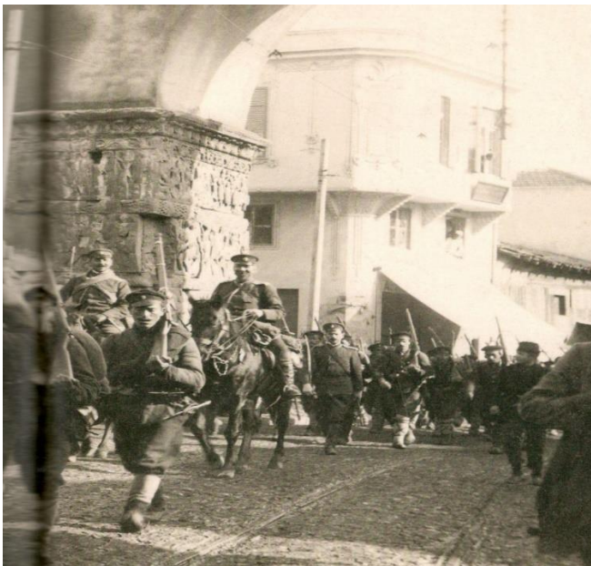
Ο Βουλγαρικός Στρατός στην Θεσσαλονίκη (Καμάρα).