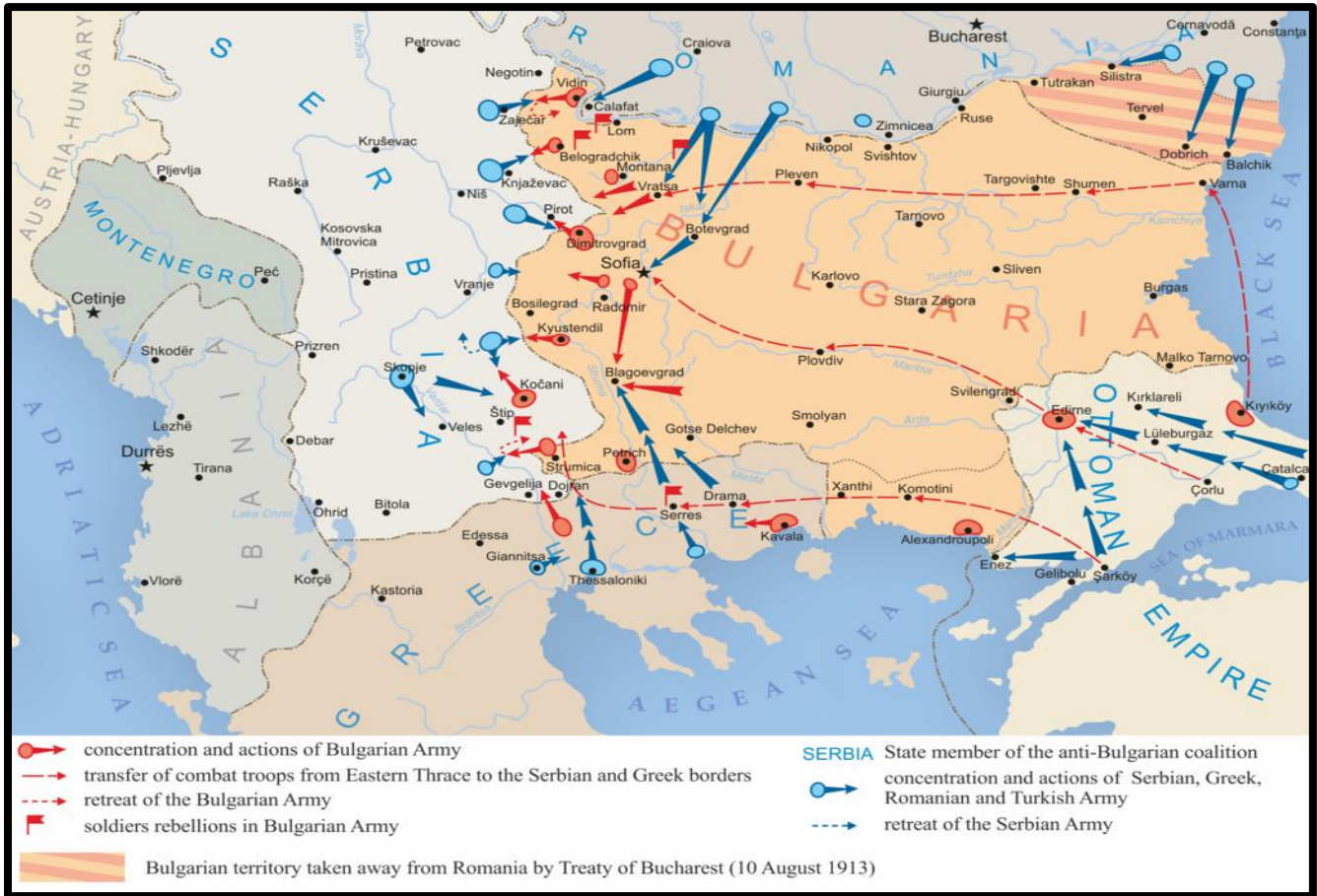
Χάρτης του Β' Βαλκανικού Πολέμου.