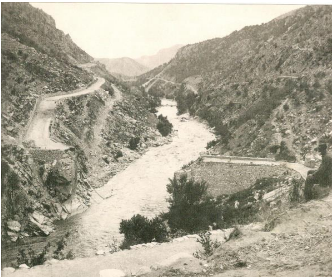
Τα Στενά της Κρέσνας

Την 18 η Ιουλ/30 η Αυγ 1913, υπογράφηκε πενθήμερος ανακωχή των εμπολέμων, ημερομηνία η οποία θεωρείται ως η λήξη του Β' Βαλκανικού Πολέμου. Την ημέρα εκείνη στο ύψωμα 1378, έπεσε ο ήρωας του Μπιζανίου, Αντισυνταγματάρχης Πεζικού Ιωάννης Βελισσαρίου.