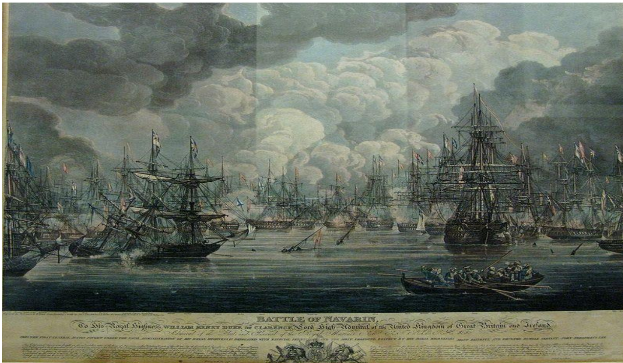
Η Ναυμαχία του Ναυαρίνου, Εθνικό Ιστορικό Μουσείο, Αθήνα, Ελλάδα.

Μετά από αυτό οι ναύαρχοι συμφώνησαν ότι ο Ιμπραήμ παραβιάζει τις συμφωνίες και απαίτησαν από αυτόν να αποπλεύσουν τα πλοία του προς Αίγυπτο ή Κωνσταντινούπολη αλλιώς θα του επιτεθούν. Ο συμμαχικός στόλος εισήλθε στην Πύλο την 8/20 Οκτωβρίου και άρχισε να παίρνει θέσεις μάχης. Ο Κόδριγκτον, πάνω στο πλοίο του «Ασία» (84 πυροβόλα), έλαβε μήνυμα ότι «ο Ιμπραήμ δεν είχε δώσει την άδεια για να εισέλθει ο συμμαχικός στόλος στο λιμάνι», στο οποίο απάντησε ότι «δεν ήλθε για να λάβει διαταγές αλλά για να δώσει» και ότι «αν ριχτεί πυροβολισμός κατά του συμμαχικού στόλου θα καταστρέψει τον τουρκικό, και ότι δεν θα λυπηθεί αν του δοθεί αυτή η ευκαιρία.»