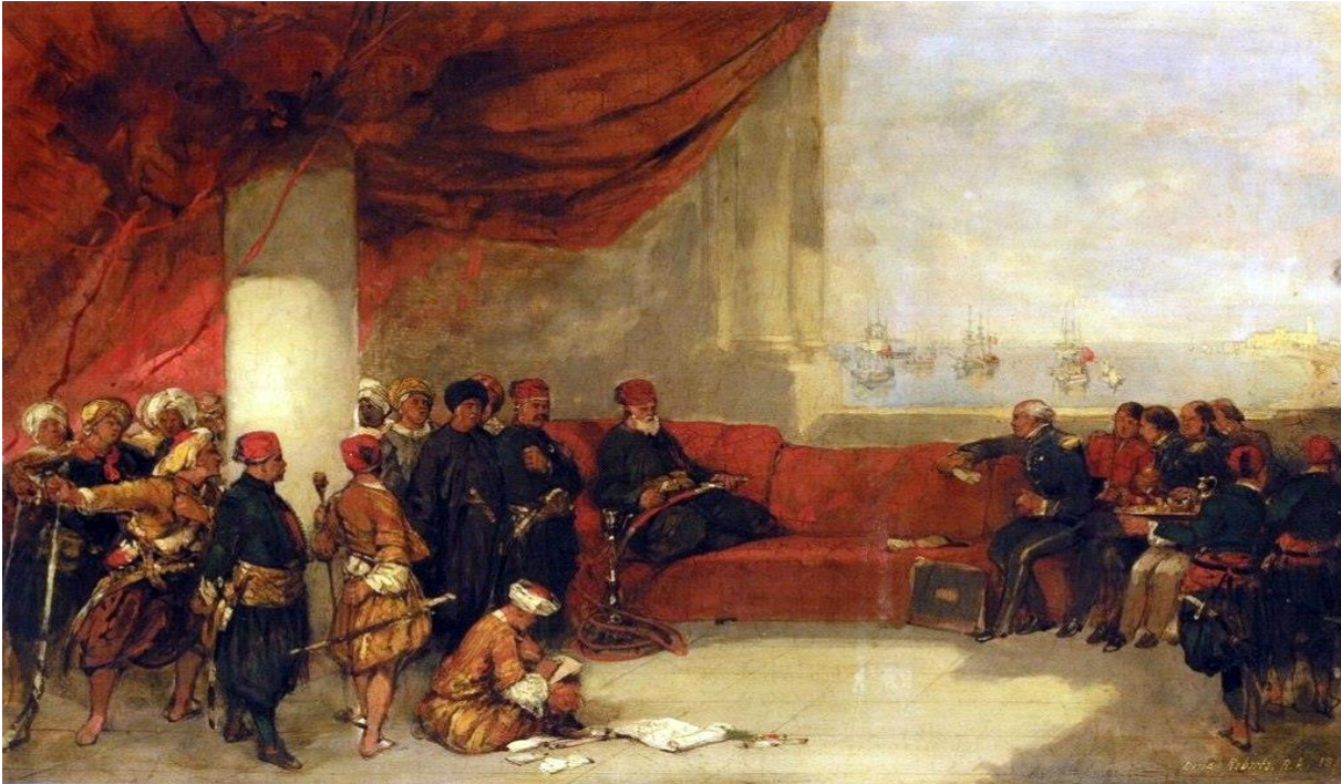
Ο Βρετανός Ναύαρχος Κοδρινγκτον (κέντρο) διαπραγματεύεται στο παλάτι του Μεχμέτ Αλή Πασά στην Αλεξάνδρεια, την Αίγυπτο (1828).

Την επομένη ημέρα οι σύμμαχοι απαίτησαν από τον Ιμπραήμ, που στο μεταξύ είχε καταφύγει στα βουνά της Μεσσηνίας , να υψώσει λευκή σημαία σε όλα τα φρούρια με την απειλή ότι αν ριχτεί έστω και ένας πυροβολισμός θα θεωρηθεί ως κήρυξη πολέμου. Οι Οθωμανοί αποδέχτηκαν και υπεγράφη ανακωχή πάνω στην ναυαρχίδα του Κόδρινγκτον.