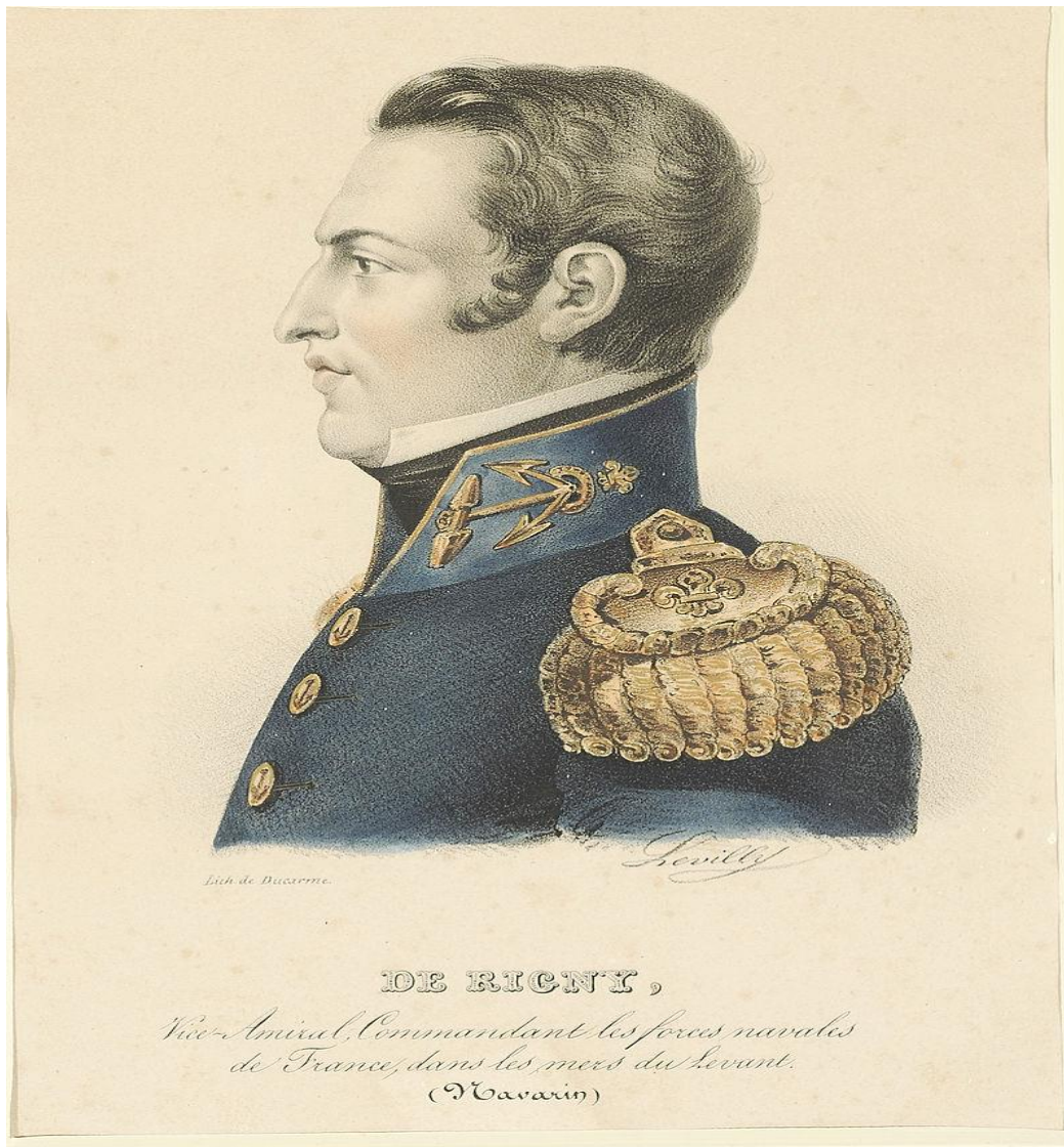
Ο Γάλλος ναύαρχος Δε Ριγνύ που έλαβε μέρος στη Ναυμαχία του Ναβαρίνου το 1827. Επιζωγραφισμένη λιθογραφία του Levilly. Εθνικό Ιστορικό Μουσείο, Συλλογή.

την πολιτική του προκατόχου τους υπερβολικά αντιοθωμανική και αποσκοπώντας στην ενίσχυση της Οθωμανικής Αυτοκρατορίας ως ανάχωμα σε πιθανή κάθοδο της Ρωσίας στη Μεσόγειο, χαρακτήρισαν τη ναυμαχία και το αποτέλεσμα της ως απρόοπτο συμβάν, (untoward event), κατά τις προγραμματικές δηλώσεις της τον Ιανουάριο του 1828 . [8] Το 1828 ο Κόδριγκτον απηλλάγη από τα καθήκοντά του με το αιτιολογικό ότι επέτρεψε τη μεταφορά Ελλήνων σκλάβων από την Πελοπόννησο προς την Αλεξάνδρεια μέσα στα πλοία του Ιμπραήμ που αποχωρούσαν.