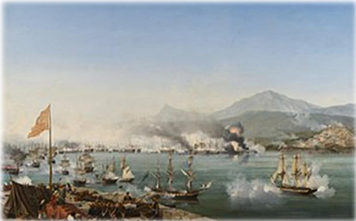
Η ναυμαχία του Ναυαρίνου (1827). Ελαιογραφία του Γκαρνερέ .

Η ναυμαχία στο Ναυαρίνου έγινε στις 8/20 Οκτωβρίου του 1827 , κατά τη διάρκεια της ελληνικής επανάστασης (1821–1832) στον κόλπο Ναυαρίνο , στη δυτική ακτή της χερσονήσου της Πελοποννήσου στο Ιόνιο Πέλαγος .