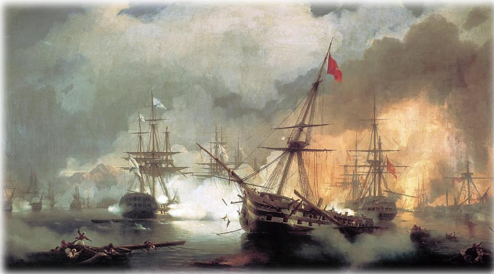
Η Ναυμαχία του Ναυαρίνου, Ιβάν Αϊβαζόφσκι.

Την 6η Σεπτεμβρίου ( παλαιό ημερολόγιο ) συνέβη ναυτικό επεισόδιο μεταξύ βρετανικών και τουρκαιογυπτιακών πλοίων στα παράλια της Παρνασσίδας (εκεί όπου πολλά χρόνια αργότερα δημιουργήθηκε η κωμόπολη της Ιτέας και συγκεκριμένα στην τότε θέση Σκάλα Σαλώνων ), όπου το ατμόπλοιο «Καρτερία» με κυβερνήτη το Φρανκ Χέιστινγκς κατέστρεψε 6 μικρά τουρκικά σκάφη και ένα αλγερινό . Μετά από αυτό, την 19 Σεπτεμβρίου, σημαντική μοίρα του τουρκαιογυπτιακού στόλου παραβίασε την υπόσχεση και απέπλευσε από την Πύλο για να τιμωρήσει τα βρετανικά πλοία. Ο ναύαρχος Κόδριγκτον ορμώμενος από τη Ζάκυνθο με δύο μόνο πλοία (μέρος του στόλου του είχε σταλεί στη Μάλτα για επισκευές) ανάγκασε την τουρκαιογυπτιακή μοίρα να επιστρέψει στο λιμάνι αλλά ο Ιμπραήμ έστειλε στρατό στην ξηρά όπου προέβη σε εμπρησμούς και καταστροφές των καλλιεργειών ως αντίποινα. Ο καπετάνιος Χάμιλτον που αποβιβάστηκε στη ξηρά μαζί με Ρώσο αξιωματικό, σε αναφορά του προς τον Κόδριγκτον ανέφερε ότι πυκνοί καπνοί αναδύονταν, και γυναίκες και παιδιά πέθαιναν από την πείνα μή έχοντας για τροφή τίποτα περισσότερο από χόρτα. Κάποιοι είχαν βρει καταφύγιο στα βουνά όπου ο Χάμιλτον υποσχέθηκε να στείλει λίγο ψωμί. Κατέληγε με την εκτίμηση ότι «αν ο Ιμπραήμ παραμείνει στην Ελλάδα, περισσότερο από το ένα τρίτο των κατοίκων θα λιμοκτονήσει». Μετά από αυτή την αναφορά οι τρεις ναύαρχοι έστειλαν επιστολή διαμαρτυρίας προς τον Ιμπραήμ, αλλά έλαβαν την απάντηση ότι αυτός ήταν άφαντος.