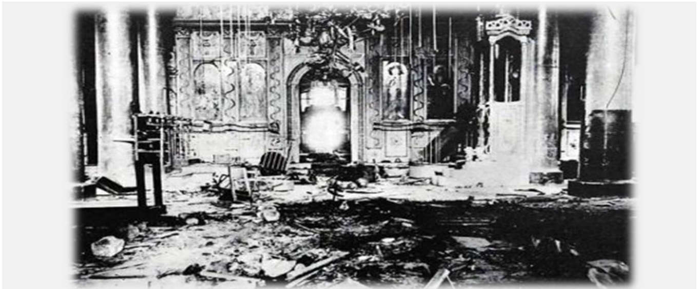
Εσωτερικό εκκλησίας της Κωνσταντινούπολης μετά τον βανδαλισμό της από τον κρατικό όχλο.

Η τουρκάλα κοινωνική ανθρωπολόγος Ντουρκάν Τουρκέρ στο βιβλίο της «Δεν έχω πατρίδα, έχω τον τόπο μου. Ρωμιοί της Πόλης, χώρος, μνήμη, τελετουργίες» (εκδόσεις Πατάκη), μιλά για την θλίψη των Ρωμιών, να θεωρούνται ξένοι στην πόλη που έζησαν για αιώνες.