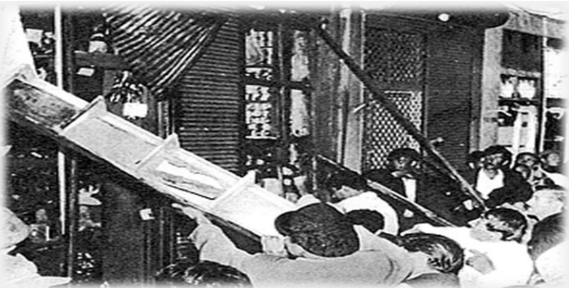
Ο τουρκικός όχλος σε πλήρη δράση καταστρέφει καταστήματα Ελλήνων της Κωνσταντινούπολης.