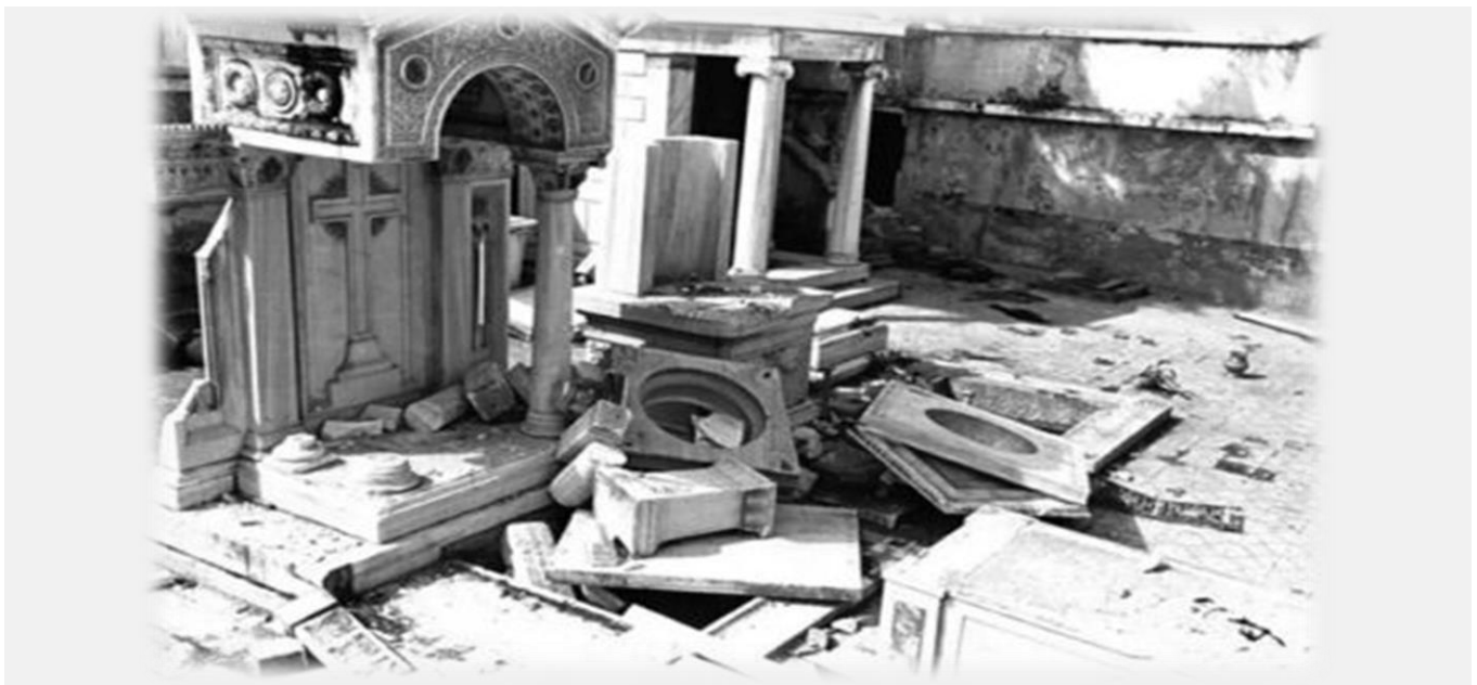
Κατεστραμμένοι τάφοι Κωνσταντινουπολιτών.

Επειδή ήταν απαγορευμένη η σταδιοδρομία τους στο δημόσιο, επιδόθηκαν στο εμπόριο, στη βιομηχανία, στην κοινοτική δράση, στις τέχνες, στην εκπαίδευση με τα εξαιρετά τους σχολεία, στον αθλητισμό -πασίγνωστος στην Τουρκία ο ομογενής ποδοσφαιριστής Λεφτέρ Κιουτσουκαντωνιάδης που του στήσαν και άγαλμα. Με το σύνθημα «δώσε στον Λευτέρη, θα γράψει στο τεφτέρι», (βερ Λεφτερέ γιαζίν τεφτερέ), τον αποχαιρέτησαν στο θάνατό του δέκα χιλιάδες οπαδοί της Φενέρ-μπαχτσέ. Ανάμεσά τους και ο Ερντογάν. Στην ιατρική, διάσημος έμεινε ο ιδρυτής της Ερυθράς Ημισελήνου -αντίστοιχο του Ερυθρού Σταυρού, ο Έλληνας Μάρκος Πασσάς Πιτσιπιός που η προσφορά του ήταν τόσο μεγάλη, ώστε ακόμα και σήμερα να λένε στην Τουρκία την παροιμία «ανλάτ ντερτινί Μάρκο Πασαγιά» που θα πει «πες τον καημό σου στον Μάρκο Πασσά».