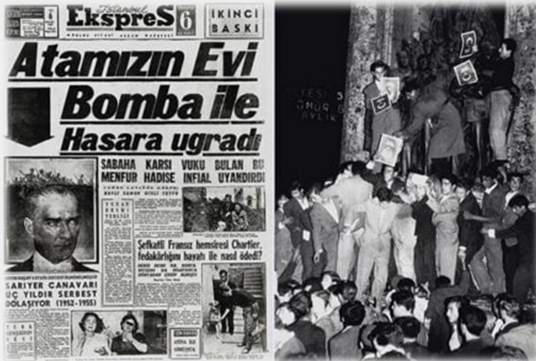
Το πρωτοσέλιδο της εφημερίδας «Ισταμπούλ Εξπρές» της 6ης Σεπτεμβρίου 1955 και τούρκοι διαδηλωτές.

Πάντως το έγκλημα δεν ήταν στιγμιαίο ή τουλάχιστον ένα πογκρόμ που κράτησε ένα βράδυ, αφού και στην συνέχεια παρ' όλη και την καταδίκη των γεγονότων αυτών και τον απαγχονισμό των πολιτικών που ευθύνονταν, όπως και για άλλους λόγους, τέθηκε σε εφαρμογή σχέδιο για την εκδίωξη του ελληνισμού από την Πόλη;