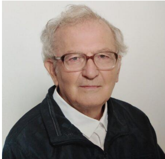
Ο συγγραφέας Γιάννης Πατσώνης.

Εδώ, όμως, θα πρέπει να παραχωρήσουμε τον λόγο στον γιατρό και λογοτέχνη Γιάννη Πατσώνη το οποίο ευχαριστούμε θερμά.