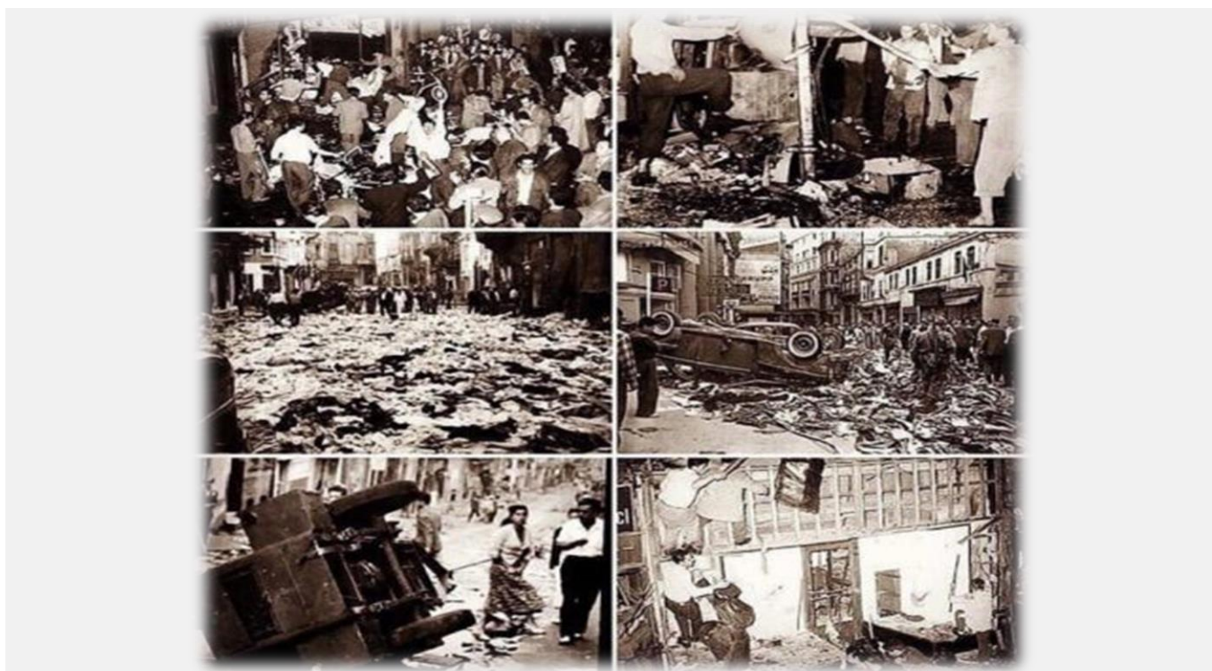
Σκηνές από τις καταστροφές που προξένησε ο τουρκικός όχλος.

Μετά τα γεγονότα του Σεπτεμβρίου του 1955 το πογκρόμ συνεχίζεται με πιο δραστικό μέσο τον διωγμό.