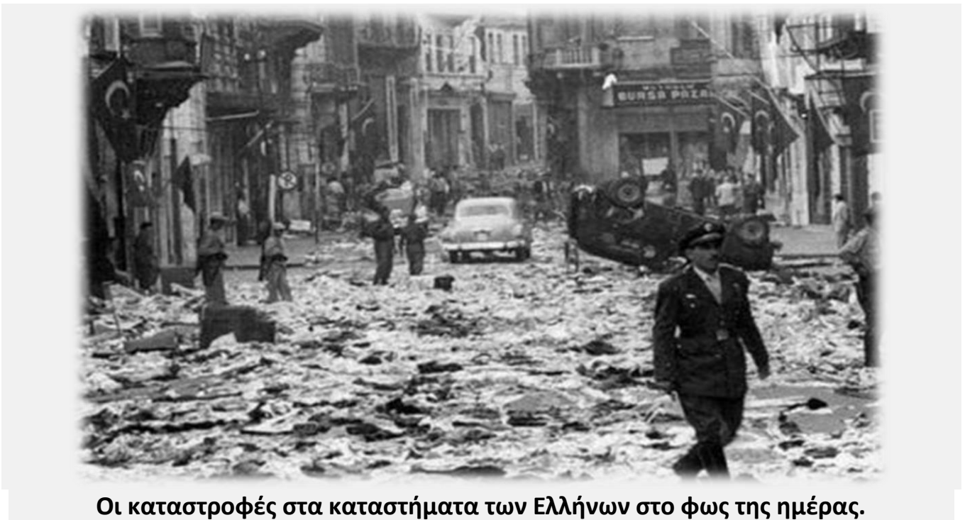
Οι καταστροφές στα καταστήματα των Ελλήνων στο φως της ημέρας.

Η Αγγλία για να μην δώσει στην Ελλάδα την Κύπρο, πραγματοποίησε με την τακτική του διαίρει και βασιλεύει, στις 29 Αυγούστου του '55, στο Λονδίνο, την τριμερή συνεδρία Ελλάδος, Αγγλίας, Τουρκίας. Οι αγγλικές μυστικές υπηρεσίες, διέθεσαν ένα εκατομμύριο τουρκικές λίρες και η εφημερίδα «Χουριέτ» αρθρογραφούσε εναντίον των Ελλήνων, και από τα 30.000 φύλλα, έφτασε στα 120.000. Βέβαια η συμμετοχή της Ελλάδος, όπως έγραφε ο καθηγητής Νεοκλής Σαρρής, ήταν ολέθριο σφάλμα, διότι η Ελλάδα έπρεπε να καταφύγει στον ΟΗΕ για την αυτοδιάθεση της Κύπρου, όπως επεδίωκε ο Παπάγος. Ο βαθύτερος λόγος που ήθελαν οι Άγγλοι να εμπλέξουν την Τουρκία στο κυπριακό, ήταν διότι τον Απρίλιο του 1955, ξεκίνησε στην Κύπρο, ο ανταποικιακός αγώνας της ΕΟΚΑ.