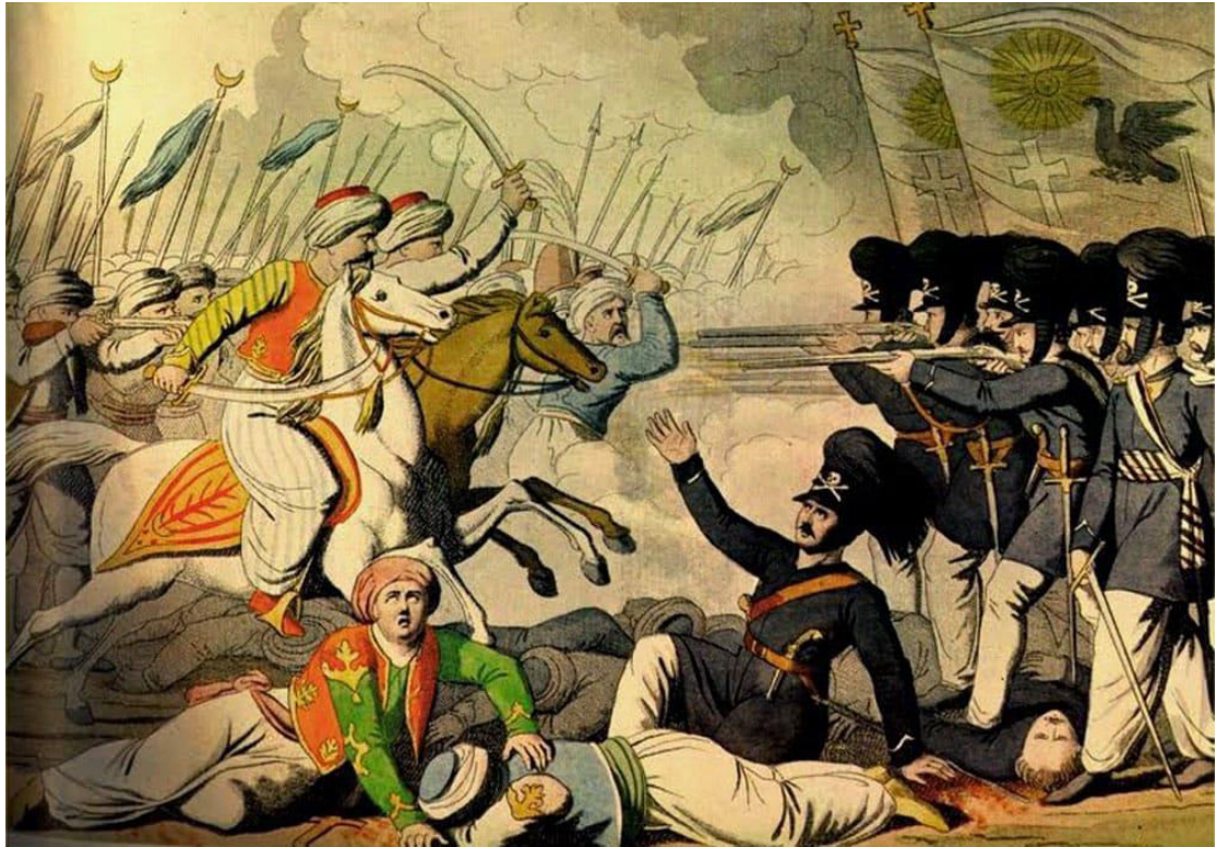
Η μάχη στο Δραγατσάν, λιθογραφία, Γενάδειος Βιβλιοθήκη.

Στις 20 Οκτωβρίου 1820 πραγματοποιήθηκε σύσκεψη των ηγετών της Εταιρείας στο Ισμαήλιο της Βεσσαραβίας (σημερινό Ιζμαίλ Ουκρανίας), όπου αποφασίστηκε η Επανάσταση να αρχίσει πρώτα από τη Μάνη. Όμως, στις 16 Φεβρουαρίου 1821 ο Υψηλάντης αποφάσισε να ξεκινήσει την επανάσταση από τη Μολδοβλαχία, πιστεύοντας ότι υπήρχαν μεγαλύτερες πιθανότητες επιτυχίας. Στις 17 Μαρτίου οι επαναστατικές δυνάμεις υπό την καθοδήγηση του Αλέξανδρου Υψηλάντη κατέλαβαν δίχως αντίσταση το Βουκουρέστι (τότε πρωτεύουσα της Βλαχίας) και ύψωσαν την επαναστατική σημαία. Η πρώτη ένοπλη σύγκρουση με τους Οθωμανούς έλαβε χώρα στην περιοχή του Γαλασίου, αλλά ήταν περιορισμένης έκτασης, έληξε δε με διάσπαση των σουλτανικών γραμμών από τα ελληνικά τμήματα στα οποία επικεφαλής ήταν ο οπλαρχηγός Καρπενησιώτης. Οι μάχες εντάθηκαν σύντομα, με αποκορύφωμα τη Μάχη του Δραγατσανίου τον Ιούνιο του 1821, όπου οι επαναστατικές δυνάμεις νικήθηκαν και απειλήθηκαν με ολοσχερή καταστροφή. Με μια μικρή σύντομη αποτίμηση θα λέγαμε ότι ο Ελληνικός στρατός νικήθηκε λόγω κάποιων κακών συγκυριών όπως π.χ της άρνησης του ηγέτη των Βλάχων Θεόδωρου Βλαδιμιρέσκου να βοηθήσει οικονομικά και στρατιωτικά την επανάσταση και λόγω του αφορισμού της από τον Πατριάρχη Γρηγόριο Ε΄. Ο Αλέξανδρος Υψηλάντης καταδιωκόμενος από τους Τούρκους, πέρασε στην Αυστρία, όπου και συνελήφθη από τους Αυστριακούς. Αποφυλακίστηκε στα τέλη του 1827, αλλά δεν πρόλαβε να χαρεί την