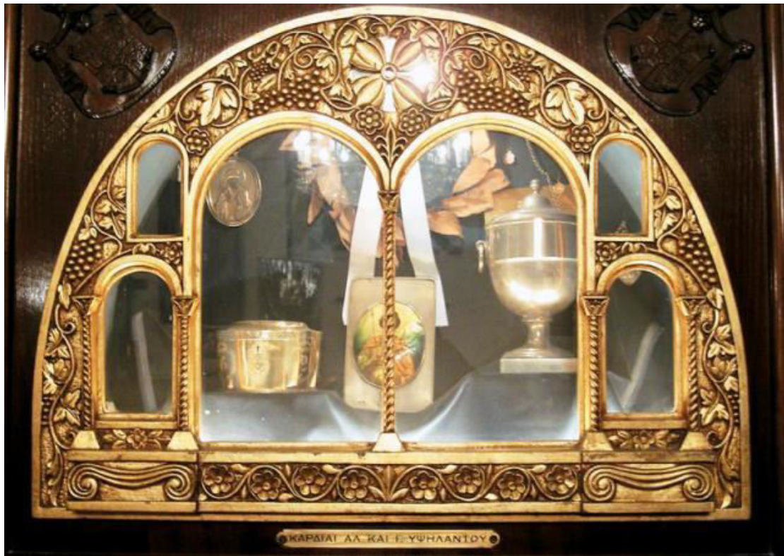
Οι δύο λήκυθοι με τις καρδιές του Αλέξανδρου Υψηλάντη και του αδελφού του Γεωργίου Υψηλάντη.

κορασίδων (τον θεματοφύλακα των Καρδιών των Υψηλαντών, οι οποίες φυλάσσονται στον Ιερό Ναό των Παμμεγίστων Ταξιαρχών των Αθηνών). Οι καρδιές του Αλέξανδρου Υψηλάντη και του αδελφού του Γεωργίου Υψηλάντη, «χτυπούν» πίσω από το Προεδρικό Μέγαρο και το Μέγαρο Μαξίμου, στο ναό των Παμμεγίστων Ταξιαρχών εδώ και δεκαετίες. Βρίσκονται μέσα σε ειδική προθήκη που έχει τοποθετηθεί αριστερά του δεσποτικού θρόνου και σε υψηλό σημείο. Εκεί είναι οι δύο λήκυθοι. Στον επάργυρο βρίσκεται η καρδιά του μεγάλου ηγέτη της Φιλικής Εταιρείας και αρχηγού της Ελληνικής Επανάστασης στις παραδουνάβιες ηγεμονίες Αλέξανδρου Υψηλάντη και στον επίχρυσο η καρδιά του αδελφού του Γεωργίου.