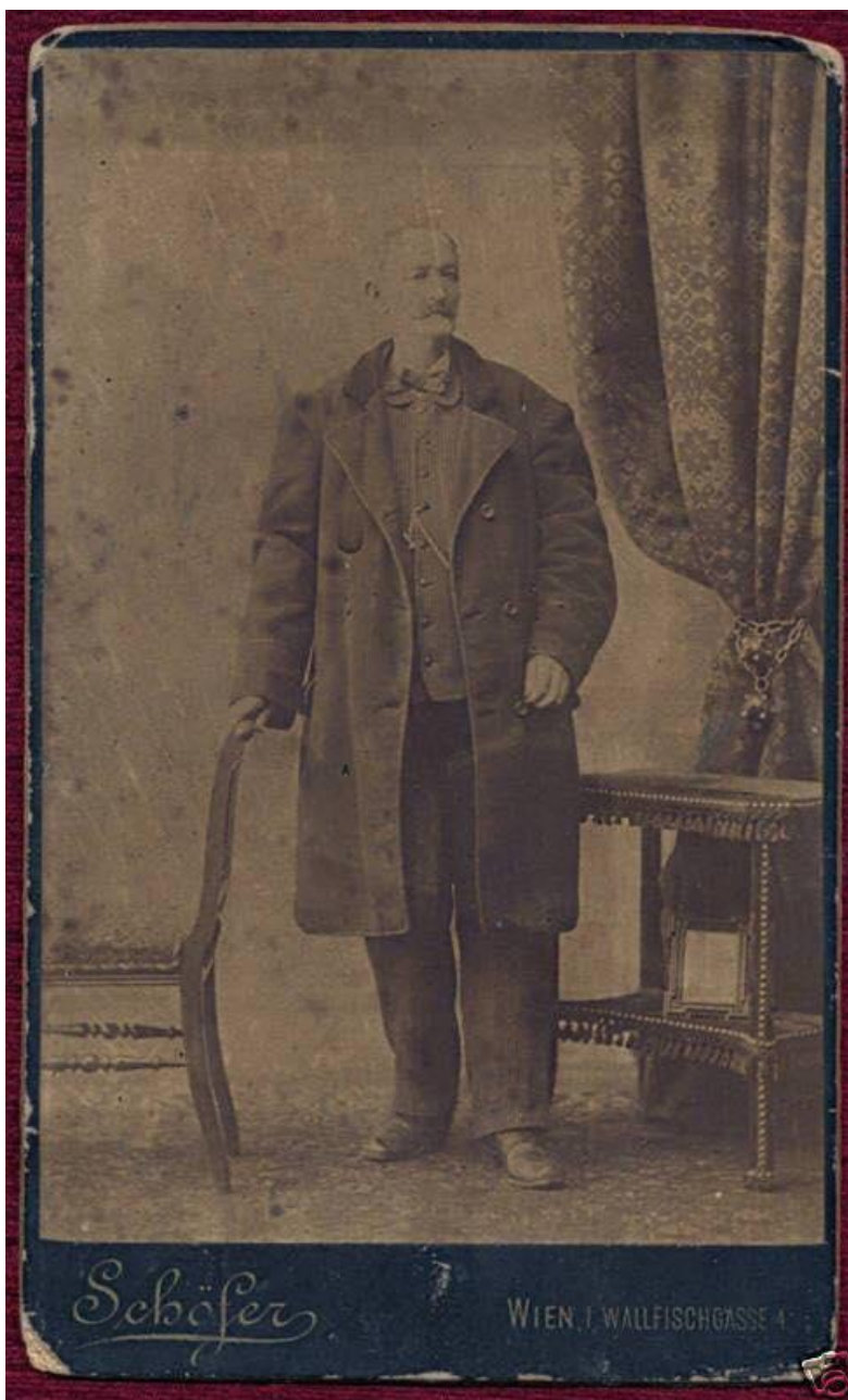
Στέργιος Δούμπας, δωρητής Πανεπιστημίου Αθηνών και Εθνικός ευεργέτης.