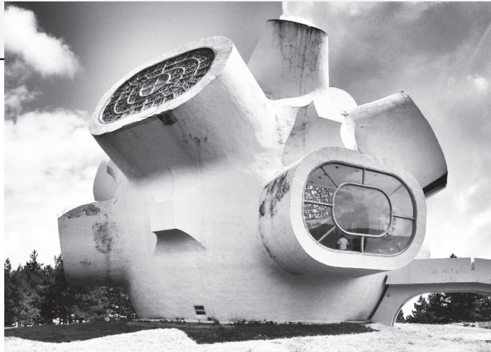
Το μνημείο της εξέγερσης του Ίλιντεν, γνωστό και ως «Μακεντόνιουμ», στο Κρούσοβο των Σκοπίων.

Αξίζει να επιμεινουμε λίγο περισσότερο σε αυτό το τελευταίο εδάφιο. Πράγματι, κατά τις εκτεταμένες ανταλλαγές των πληθυσμών στη Μακεδονία, αποχώρησαν εκατοντάδες χιλιάδες Τούρκοι και σχεδόν εκατό χιλιάδες Βούλγαροι ή βουλγαρίζοντες Σλάβοι και στα ίδια εδάφη εγκαταστάθηκαν εκατοντάδες χιλιάδες Έλληνες πρόσφυγες από τον Πόντο, την Ανατολική Θράκη, τη Μικρά Ασία και την Ανατολική Ρωμυλία. Συνεπεία αυτών των διασταυρούμενων μετακινήσεων, η ελληνική Μακεδονία κατέστη σε μεγάλο βαθμό ομοιογενής εθνικά και οι εναπομείνουσες γλωσσικές ή εθνοτικές μειονότητες (η εβραϊκή και η σλαβική κυρίως) αντιπροσώπευαν μόλις το 10% του πληθυσμού. Έτσι, το αίτημα της «Ανεξάρτητης Μακεδονίας- Θράκης» δεν ήταν πλέον απλώς αναχρονιστικό και εξωπραγματικό, από εθνοτική άποψη, αλλά στην πραγματικότητα «το σχίσμο των άτιμων συνθηκών των ανταλλαγών των πληθυσμών» ήταν πλέον εντελώς ανέφικτο, διότι δεν αφορούσε απλώς συνθήκες αλλά παγιωμένες πραγματικότητες ανεπιστρεπτή. Διότι η