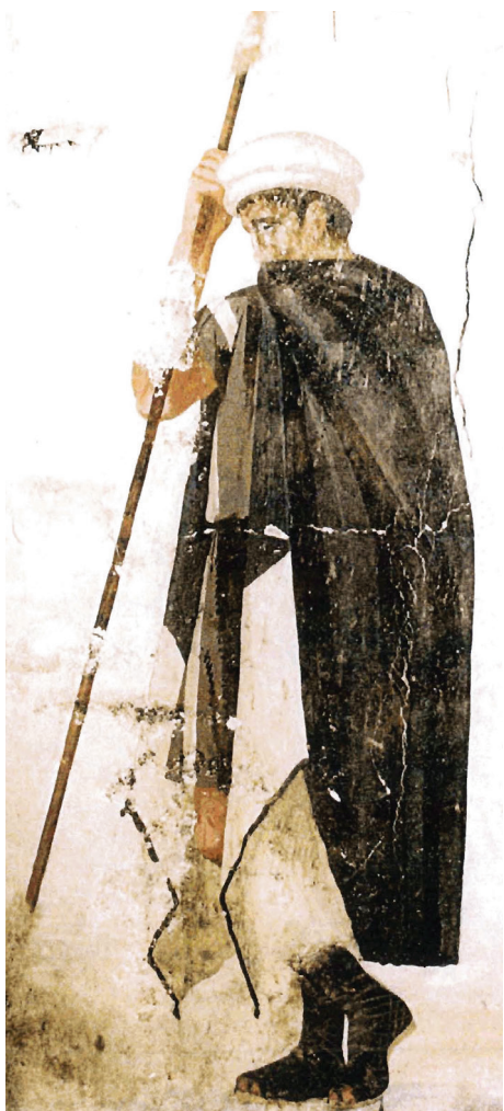
Τοιχογραφία στρατιώτη στον μακεδονικό τάφο στον Άγιο Αθανάσιο (4 ος αι. π.Χ.).

Ε ν τούτοις, στα πλαίσια της ενίσχυσης των εθνομηδενιστικών τάσεων στο εσωτερικό της Αριστεράς από τις αρχές της δεκαετίας του 1990, εγκαταλείπονται σταδιακά τοποθετήσεις όπως εκείνη του Συνασπισμού των αρχών της δεκαετίας του 1990. Αντίθετα, ιδιαίτερα μετά το 2000, η εξωκοινοβουλευτική Άκρα Αριστερά, οι Οικολόγοι, ο Συνασπισμός, αλλά και το ΚΚΕ θα αρχίσουν να επιστρέφουν στον πατροπαράδοτο «μακεδονισμό» ξανασυναντώντας τις παλιές καλές παραδόσεις του πρώιμου ΚΚΕ. Ιδιαίτερο ρόλο σε αυτή την επιστροφή στις ρίζες θα διαδραματίσουν διανοούμενοι και ακαδημαϊκοί που θα συμπεριλάβουν την επιστροφή στον μακεδονισμό στο συνολικό εγχείρημα της «κατεδάφισης των εθνικών μύθων» το οποίο θα αναλάβει η διαρκώς ενισχυόμενη επί δύο τουλάχιστον δεκαετίες εθνομηδενιστική Αριστερά 44 .