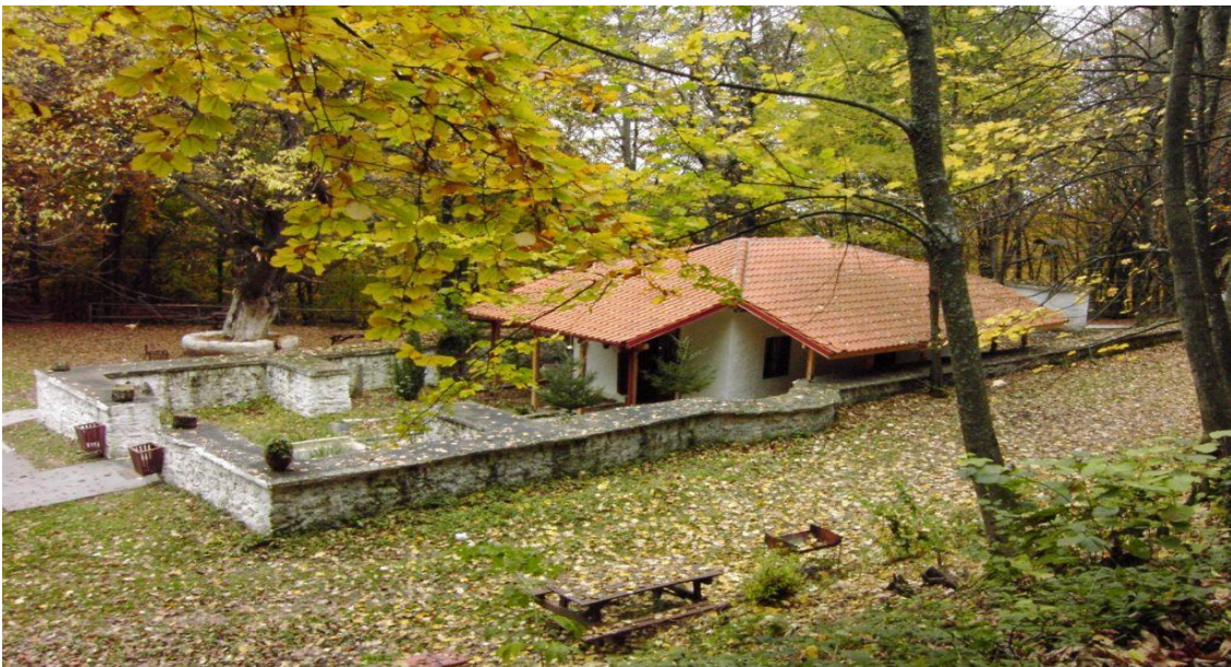
Το Εξωκκλήσι που βρίσκεται σήμερα στην θέση της (κατεστραμμένης το 1822) Ιεράς Μονής Ταξιαρχών Βερμίου.

Ναουσαίοι μέχρι σήμερα, σώζουν την εξής παράδοση. Για τις καθημερινές ανάγκες ανοικοδόμησης, δανείστηκε ένα γαϊδούρι, από το μοναστήρι του Τιμίου Προδρόμου, το οποίο όμως κατέφαγε μια από τις πολλές αρκούδες του Βερμίου. Ο όσιος αφού φόρεσε το σαμάρι του γαϊδουριού στην αρκούδα, την κράτησε όσες μέρες χρειάστηκε για να εκτελεί τα καθήκοντα αυτού που κατέφαγε. Την άφησε ελεύθερη μόλις ολοκληρώθηκε το μοναστήρι, με το επιτίμιο θα έλεγε κανείς, να φύγουν όλες οι αρκούδες από την περιοχή του Βερμίου, παράδοση που εξηγεί και την απουσία αρκούδων, ενώ παλαιότερα η περιοχή ήταν γεμάτη από αυτές.