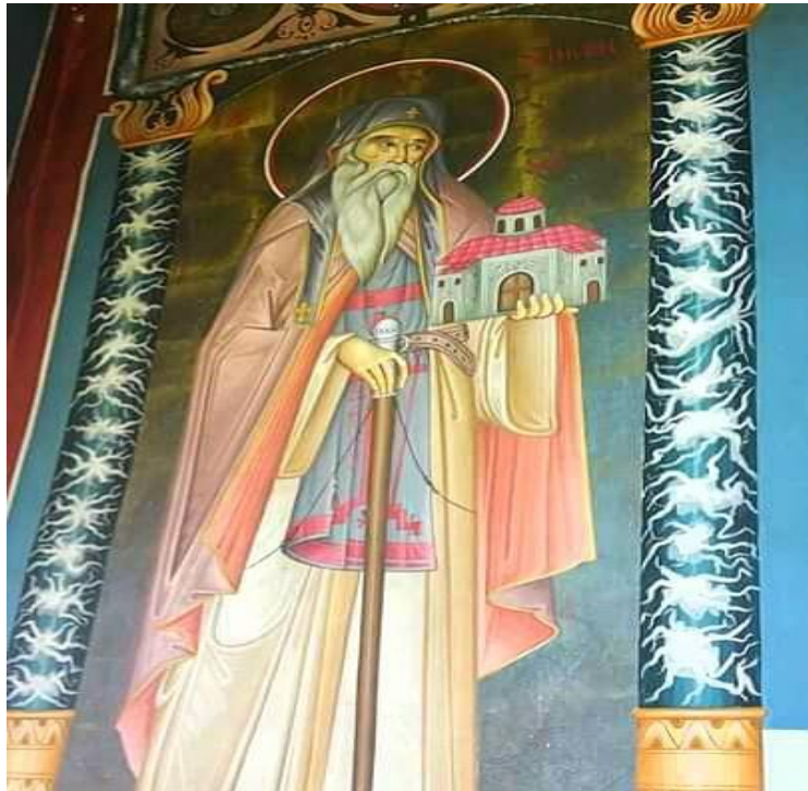
Σύγχρονη τοιχογραφία του Οσίου, στον μικρό του Ι. Ναό.