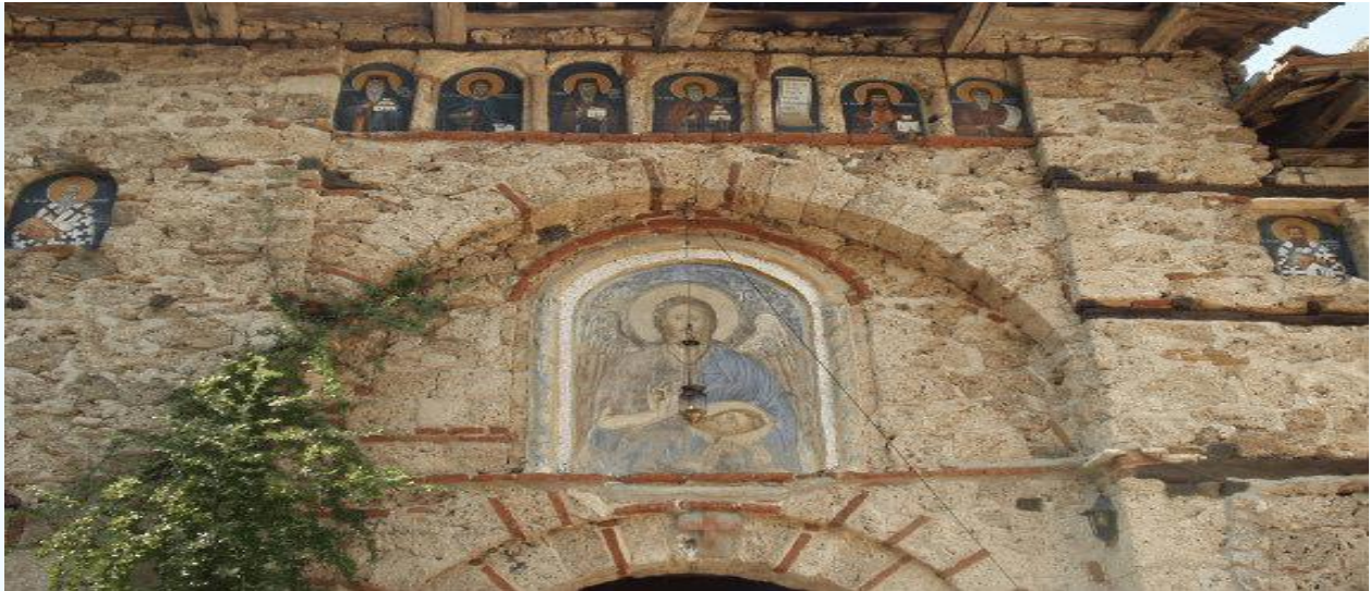
Ι.Μ. Τιμίου Προδρόμου, Σκήτη Βεροίας.

τεύσε ο άγιος Γρηγόριος ο Παλαμάς με την αγία του οικογένεια, ο Άγιος Αντώνιος ο Νέος, πολιούχος Βεροίας και πολλοί άλλοι.