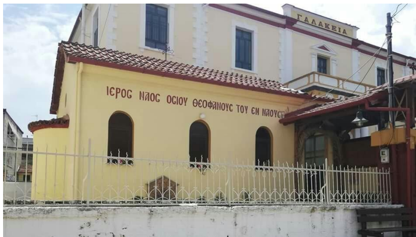
Ο μικρός Ιερός Ναός του Οσίου Θεοφάνους στη Νάουσα.

Σημαντικές πληροφορίες για την θαυμαστή ζωή αυτού, του άγνωστου σε πολλούς, αγίου της Εκκλησίας μας, μπορεί να εντοπίσει κανείς στο βιβλίο «Ο ΙΔΡΥΤΗΣ ΤΗΣ ΜΟΝΗΣ ΤΑΞΙΑΡΧΩΝ ΒΕΡΜΙΟΥ ΚΑΙ ΠΟΛΙΟΥΧΟΣ ΤΗΣ ΝΑΟΥΣΗΣ ΟΣΙΟΣ ΘΕΟΦΑΝΗΣ Ο ΝΕΟΣ», πόνημα του Σεβασμιωτάτου Μητροπολίτη Βεροίας και Ναούσης κ. Παντελεήμονος Καλπακίδη. Ο Σεβ. Βεροίας κ. Παντελεήμων επιχειρεί την πρώτη ολοκληρωμένη έκδοση (1998) που συμπεριλαμβάνει τον βίο και την ακολουθία του οσίου (που συνέθεσε ο ξακουστός υμνογράφος π. Γεράσιμος Μικραγιαννίτης), παλαιότερες ακολουθίες και βιογραφικά στοιχεία, φωτογραφικό υλικό, παραπομπές σε εργασίες ερευνητών και παράθεση ιστορικών τεκμηρίων για την θαυμαστή βιωτή του Αγίου Θεοφάνους, του εν Ναούση. Το βιβλίο του Αγίου Βεροίας αποτελεί και την βάση για την συγγραφή της παρούσας δημοσίευσης.