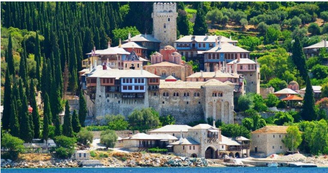
Ιερά Μονή Δοχειαρίου, Αγίου Όρους.

Γόνος ευλαβούς οικογένειας, ευλαβής από μικρός και ο ίδιος, μόλις ενηλικιώθηκε, πραγματοποίησε την έντονη επιθυμία της παιδικής του ψυχής. Έφυγε στο Άγιον Όρος κι εκάρη μοναχός στην Ιερά Μονή Δοχειαρίου.