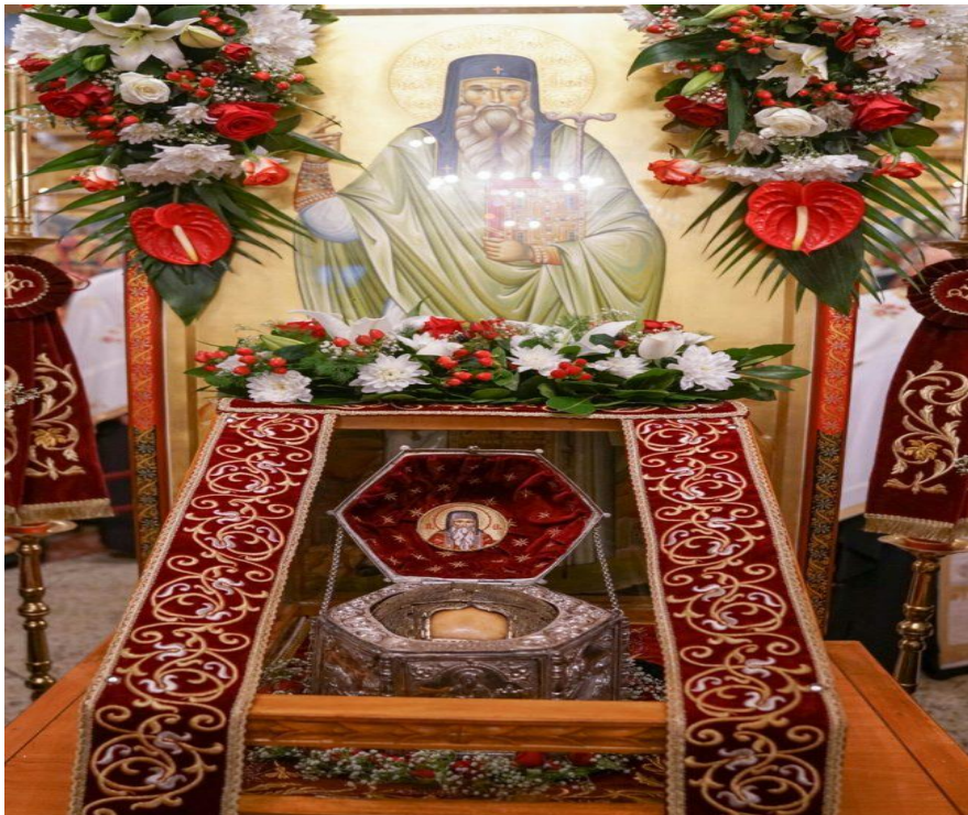
Η Τίμια Κάρα του Οσίου Θεοφάνους, Ι.Ν. Παναγίας Ναούσης.

Όσες φορές η Νάουσα, αλλά και οι γύρω πόλεις και τα γύρω χωριά κλονίστηκαν από επιδημίες ή ανομβρία και ξηρασία, λιτανεύοντας οι πιστοί την τίμια κάρα του, βρήκαν σωτηρία και απαλλαγή.