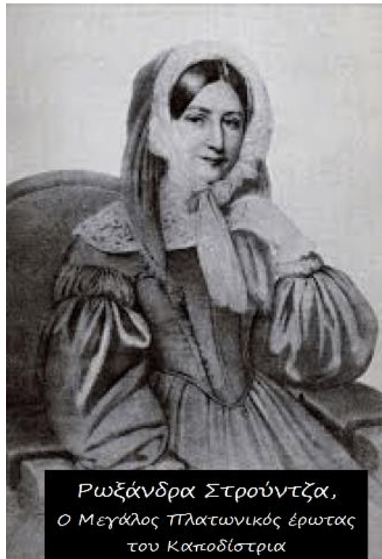
Ρωξάνδρα Στρούνιτσα, Ο Μεγάλος Πλατωνικός έρωτας του Καποδίστρια

Ο Κόμης Ι. Καποδίστριας ήταν Έλληνας διπλωμάτης και πολιτικός. Διετέλεσε υπουργός Εξωτερικών της Ρωσικής Αυτοκρατορίας. Γεννήθηκε στην Κέρκυρα στις 10/2/1776. Έκτο παιδί του Αντωνίου-Μαρία Καποδίστρια, δικηγόρου στο επάγγελμα, και της Διαμαντίνας Γονέμη, κόρης αριστοκρατικής οικογένειας με καταγωγή από την Κύπρο. Καταγόταν από παλιά κερκυραϊκή οικογένεια. Το 1477 η οικογένεια αναφέρεται στην Χρυσή Βίβλο των ευγενών της νήσου.