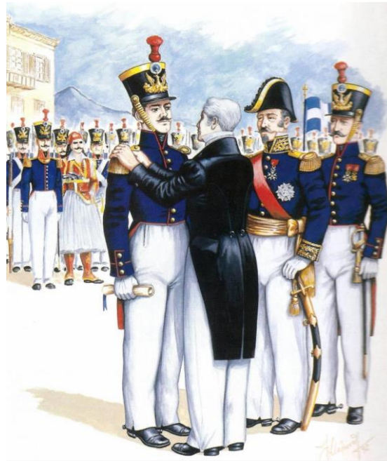
Η τελετή απονομής των επαμειβίων του αξιωματικού στους πρώτους Ευέλπιδες που ονομάστηκαν Ανθυπολοχαγοί του Πυροβολικού από τον Κυβερνήτη της Ελλάδας Ιωάννη Καποδίστρια