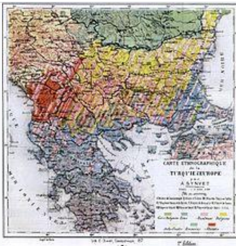
Χάρτης εθνοτικής σύνθεσης των Βαλκανίων του 1877 του Α. Συνβέ, γνωστού Γάλλου καθηγητή του Οθωμανικού Λυκείου της Κωνσταντινού-πολης.

Υπό την πίεση της Ρωσίας η Ρουμανία, η Σερβία και το Μαυροβούνιο ανακηρύχθηκαν ανεξάρτητα πριγκιπάτα. Η Ρωσία διατήρησε τη Νότια Βεσσαραβία , που είχε προσαρτήσει στο Ρωσοτουρκικό πόλεμο, αλλά το Βουλγαρικό κράτος που είχε δημιουργήσει διχοτομήθηκε αρχικά και στη συνέχεια χωρίστηκε περαιτέρω στα Πριγκιπάτα της Βουλγαρίας και της Ανατολικής Ρωμυλίας, που και τα δύο είχαν κατ' όνομα αυτονομία υπό τον έλεγχο της Οθωμανικής Αυτοκρατορίας. [17] Στη Βουλγαρία δόθηκαν εγγυήσεις εναντίον της τουρκικής παρέμβασης, αλλά αυτές αγνοήθηκαν σε μεγάλο βαθμό. Η Ρουμανία έλαβε τη Δοβρουτσά . Το Μαυροβούνιο πήρε τον Νίκσιτς μαζί με τις σημαντικές Αλβανικές περιοχές της Ποντογκόριτσα , του Μπαρ και του Πλάβ-Γκούσινιε. Η Τουρκική κυβέρνηση, ή Υψηλή Πύλη , συμφώνησε να τηρήσει τις προβλέψεις, που περιέχονταν στον Οργανικό Νόμο του 1868 και να εγγυηθεί τα πολιτικά δικαιώματα των μη Μουσουλμάνων υπηκόων. Η περιοχή της Βοσνίας-Ερζεγοβίνης παραχωρήθηκε στη διοίκηση της Αυστροουγγαρίας, που έλαβε επίσης το δικαίωμα να έχει φρουρά στο Σαντζάκι του Νόβι Παζάρ , μια μικρή παραμεθόρια περιοχή