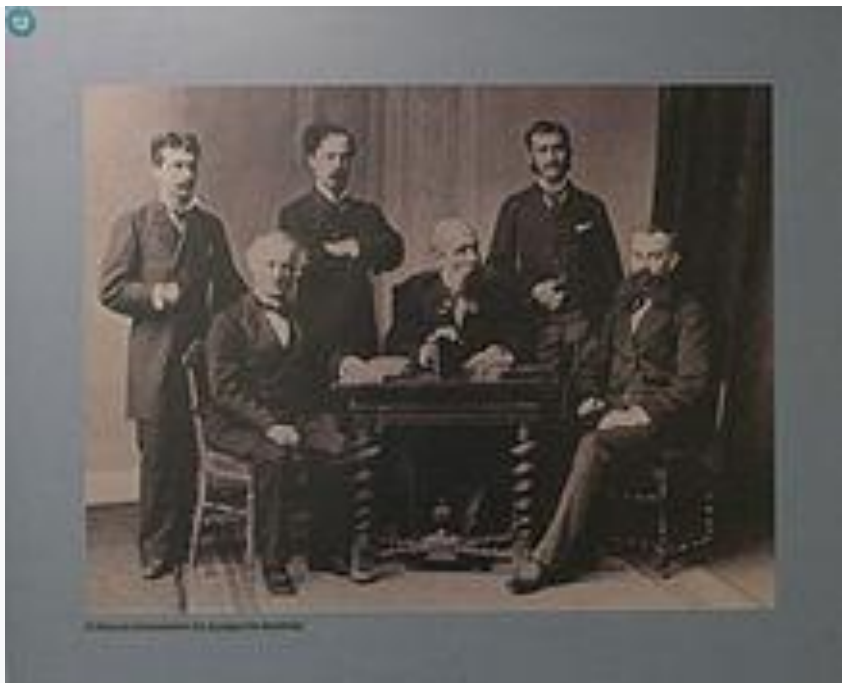
Η Ελληνική Αντιπροσωπεία στο Συνέδριο του Βερολίνου.

Ο Ρίστιτς , που ήταν ο πρώτος πληρεξούσιος της Σερβίας στο Βερολίνο, αναφέρει πώς ζήτησε από το Γιόμινι, έναν από τους Ρώσους αντιπροσώπους, τι παρηγοριά παρέμεινε στους Σέρβους. Ο Γιόμινι απάντησε ότι θα έπρεπε να έχει κατά νου ότι «η κατάσταση ήταν μόνο προσωρινή επειδή μέσα σε δεκαπέντε χρόνια το αργότερο θα αναγκαστούμε να πολεμήσουμε την Αυστρία». «Μάταιη παρηγοριά!» σχολίασε ο Ρίστιτς. [19]