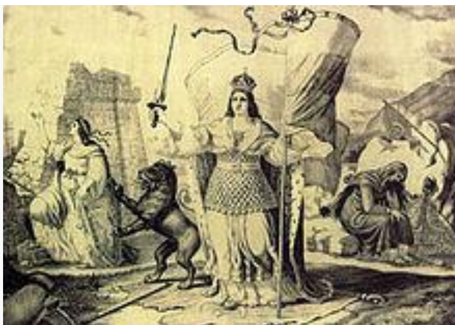
Αλληγορική απεικόνιση της Βουλγαρικής αυτονομίας μετά τη Συνθήκη του Βερολίνου . Λιθογραφία του Νικολάι Πάβλοβιτς.

μεταξύ Μαυροβουνίου και Σερβίας. Δρομολογήθηκε άμεσα η μελλοντική προσάρτηση της Βοσνίας και Ερζεγοβίνης στους Αψβούργους. Η Ρωσία συμφώνησε ότι η Μακεδονία , το πιο σημαντικό στρατηγικό τμήμα των Βαλκανίων, ήταν πολύ πολυεθνικό για να είναι τμήμα της Βουλγαρίας και επέτρεψε να παραμείνει υπό τους Οθωμανούς. Η Ανατολική Ρωμυλία , που είχε τις δικές της μεγάλες Τουρκική και Ελληνική μειονότητες, έγινε αυτόνομη επαρχία υπό Χριστιανό κυβερνήτη, με πρωτεύουσα τη Φιλιπούπολη . Το υπόλοιπο τμήμα της αρχικής "Μεγάλης Βουλγαρίας" έγινε το νέο Βουλγαρικό κράτος.