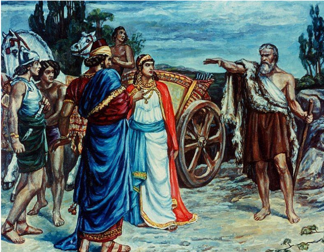
Εικόνα Ο ΠΡΟΦΗΤΗΣ ΗΛΙΑΣ ΚΑΤΑ ΤΟΥ ΑΧΑΑΒ ΚΑΙ ΤΗΣ ΙΕΖΑΒΕΛ

Ο προφήτης Ηλίας εμφανίστηκε σε μια δύσκολη εποχή για τον Ισραήλ, όταν στο βόρειο βασίλειο βασίλευε ο Αχαάβ , ένας κακός και ασεβής βασιλιάς, που επηρεαζόταν από την ειδωλολάτρισσα σύζυγό του Ιεζάβελ .