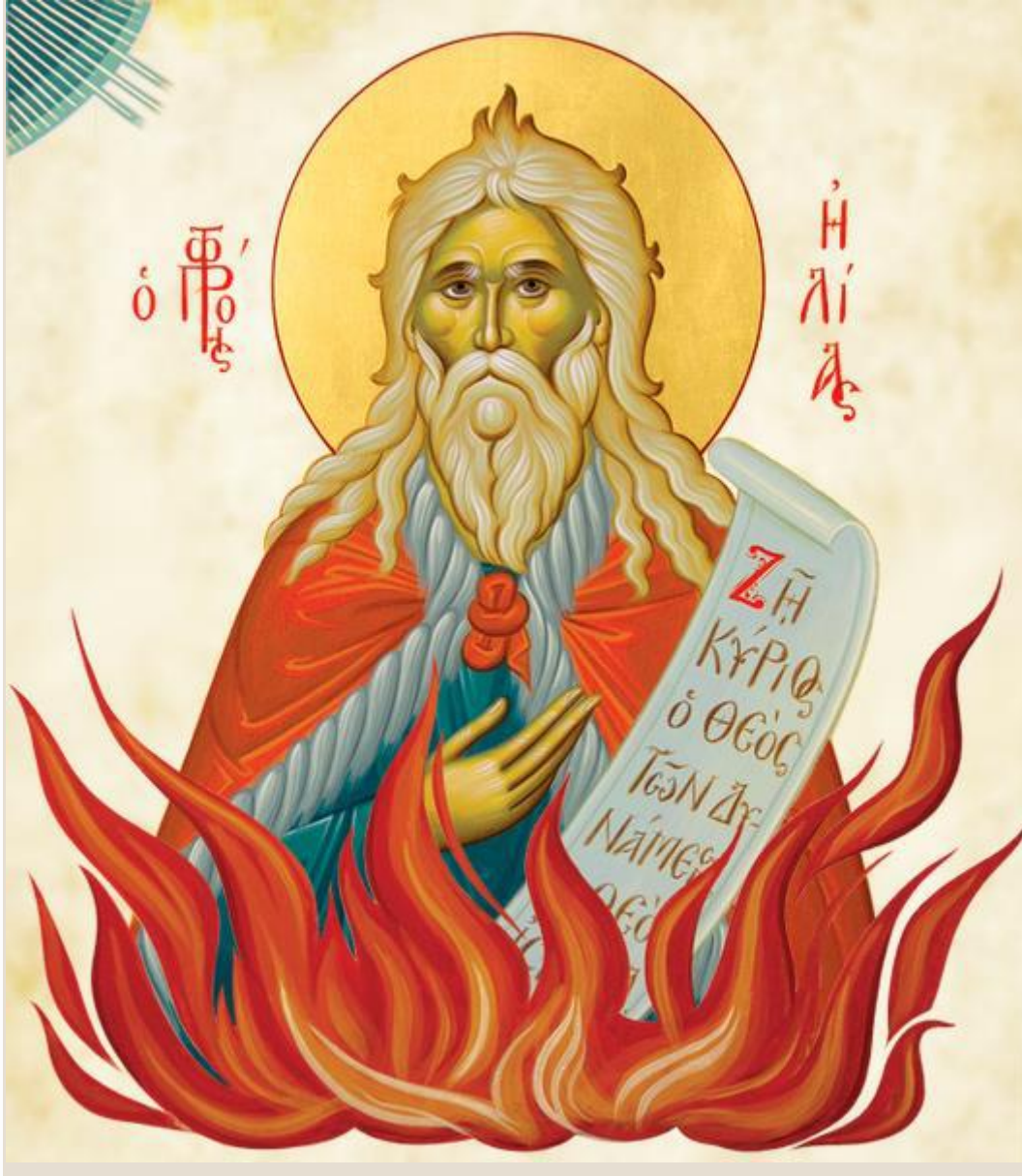
Ο ΗΛΙΑΣ ΤΗΣ ΦΩΤΙΑΣ

Με τη φωτιά, μάλιστα, έκαψε τους στρατιώτες που είχε στείλει ο βασιλιάς Οχοζίας για να τον συλλάβουν.