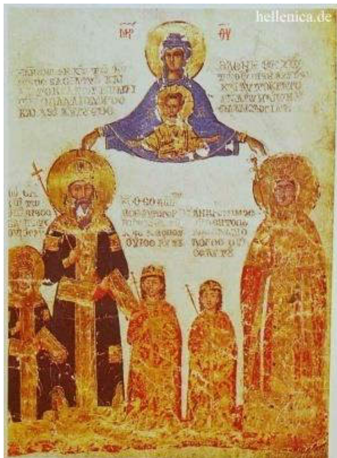
Πορταίτο του Εμμανουήλ Β΄ του Παλαιολόγου με τη σύζυγό του Ελένη (Αγία Υπομονή) και τρία από τα τέκνα τους

εισακούονταν από τα τέκνα της, η Ελένη δεν απελπίζονταν. «Δεν έπεισα σήμερα, ίσως μπορέσω να πείσω αύριο» , συνήθιζε να λέγει, μνημονεύοντας την ρήση του Αγίου Ιωάννου Χρυσοστόμου : « Ουδέν υπομονής ίσον και καρτερίας» . Έτσι, με αυτή την συμπεριφορά κατάφερνε να αμβλύνει τις συγκρούσεις μεταξύ των μελών της αυτοκρατορικής οικογένειας για την διεκδίκηση της εξουσίας που, κατά καιρούς, αποδυνάμωναν την αυτοκρατορία και ενίσχυαν τους εχθρούς της.