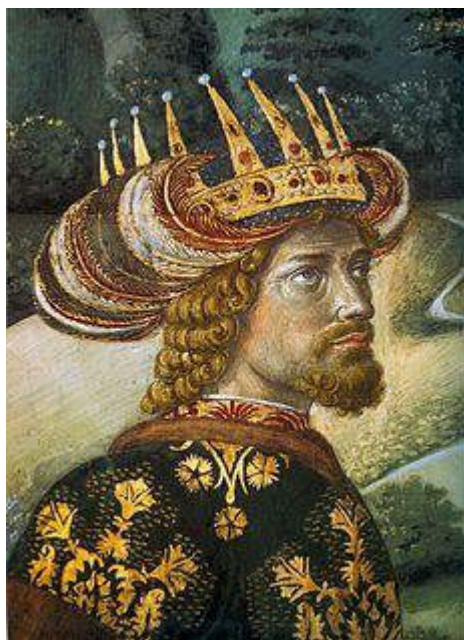
Ο Αυτοκράτωρ Ιωάννης Η΄ Παλαιολόγος σε τοιχογραφία του Β. Gozzoli στο Παλάτι των Μεδίκων στη Φλωρεντία

Δύσεως. Η Σύνοδος ξεκίνησε τις εργασίες της το 1438 στην Φλωρεντία της Ιταλίας και μετά, το 1439, στην Φεράρα, με λήξη την 1 η Φεβρ1440. Εκ μέρους της Ανατ. Εκκλησίας συμμετείχε ένα πλήθος προσωπικοτήτων με επικεφαλής τον Οικουμενικό Πατριάρχη Ιωσήφ Β΄. Μεταξύ αυτών ο Επίσκοπος Εφέσου Μάρκος Ευγενικός, ο Γ.Πλήθων-Γεμιστός, ο Γ. Σχολάριος, ο Επίσκοπος Νίκαιας Βησσαρίων, ο Επίσκοπος Κιέβου Ισίδωρος, οι Πατριάρχες Αντιοχείας, Αλεξανδρείας, Ιεροσολύμων κ.α. Οι αποφάσεις που λήφθηκαν κατά την Σύνοδο Φλωρεντίας-