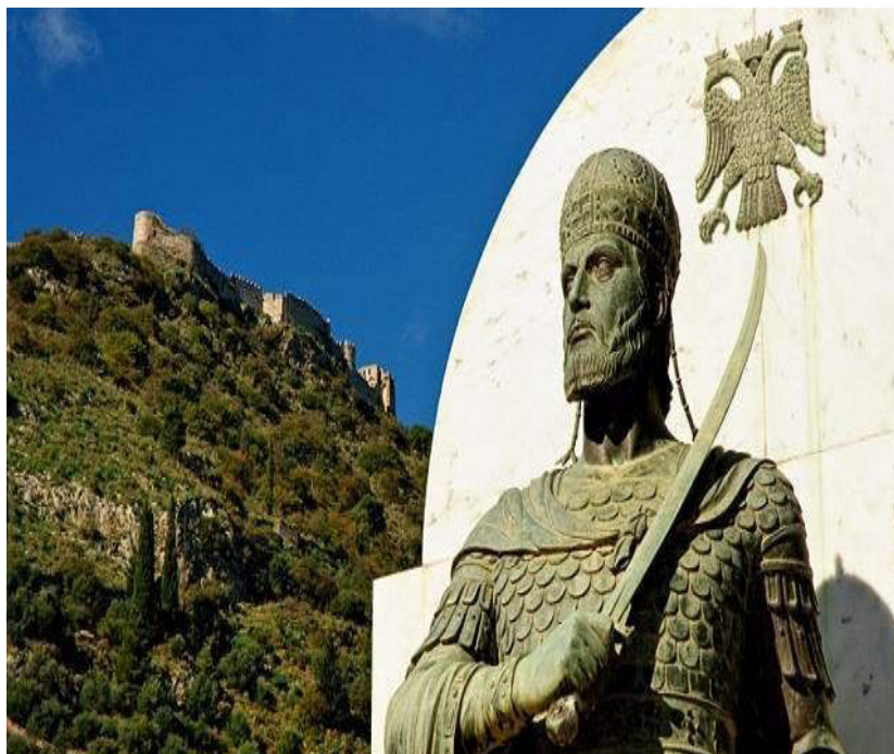
Ανδριάντας του Κωνσταντίνου ΙΑ΄ Παλαιολόγου Δεσπότη του Μυστρά

έχοντας στο πλευρό του τον μετριοπαθή αδελφό του, Θωμά . Κύριο μέλημά του ήταν, ομού με την εξύψωση του φρονήματος των Ελλήνων και η ενίσχυση της άμυνας της Πελοποννήσου. Ταχύτατα ξανάκτισε το τείχος του Εξαμιλίου που είχε γκρεμίσει ο Τούρκος στρατηγός Τουραχάν το έτος 1432 και έκλεισε συμμαχίες με τους ηγεμόνες της Σερβίας και Βοσνίας Μπράνκοβιτς και Χρίστις. Εκμεταλλευόμενος την εμπλοκή του Μουράτ αρχικά με τους Καραμάνους στην Ανατολή και κατόπιν με τους Ούγγρους και τον θρυλικό ηγέτη της Ηπείρου Γεώργιο Καστριώτη (ή Σκεντέρμπεη) στην Βαλκανική, εφάρμοσε σχέδιο απελευθέρωσης των Ελλήνων πέραν του Ισθμού της Κορίνθου. Όραμά του ήταν η δημιουργία ενός νέου βυζαντινού κράτους στο έδαφος της ηπειρωτικής Ελλάδος με πρωτεύουσα τον Μυστρά . Στην αρχή απελευθερώνει την Αττική και καθιστά τον Λατίνο Δούκα των Αθηνών Νέριο Β΄ Ατταγιόλι, φόρου υποτελή. Μετά εξορμά προς Βοιωτία, απελευθερώνει την Θήβα, την Λειβαδιά, την περιοχή Αγράφων και συμπράττει με τους Έλληνες Βλάχους της Πίνδου για την απελευθέρωση της Θεσσαλίας από τον τουρκικό ζυγό, με επιδίωξη να συνενωθεί στην Ήπειρο με τον Σκεντέρμπεη. Τον Φεβρουάριο 1445 απαλλάσσει από τους Ενετούς το Γαλαξείδι και όλη την Φωκίδα και κατόπιν την Βιτρινίτσα, στον Κορινθιακό. Ένας ούριος άνεμος ελπίδας και αισιοδοξίας πνέει τώρα στις περιοχές που απελευθερώθηκαν και κάνει τους Έλληνες να πιστεύουν ότι το Βυζάντιο αναγεννάται εκ βάθρων. Ο Κωνσταντίνος γίνεται τώρα θρύλος, δέκα χρόνια προ της υπέρτατης θυσίας του.