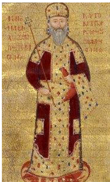
Ο ΜΑΝΟΥΗΛ Β΄

Η γενιά της Ελένης Δραγάση ( η οποία αργότερα ονομάστηκε « Αγία Υπομονή » και με αυτήν την ονομασία έμεινε στην Ιστορία), αναδείχθηκε ευλογημένη. Στους προγόνους της συγκαταλέγονται και άνθρωποι που αγίασαν, όπως ο Στέφανος Νεμάνια, Σέρβος βασιλέας και κτίτορας της Μονής Χιλανδαρίου Αγ. Όρους - Όσιος Συμεών ο Μυροβλήτης. Και επειδή οι Σέρβοι την εποχή εκείνη ήταν έντονα επηρεασμένοι από τον βυζαντινό πολιτισμό, η ανατροφή και η μόρφωση της Ελένης είχαν διαποτιστεί από την εθνική συνείδηση της βυζαντινής αυτοκρατορίας. Από τα πρώτα χρόνια της συμβίωσης του, το βασιλικό ζεύγος του