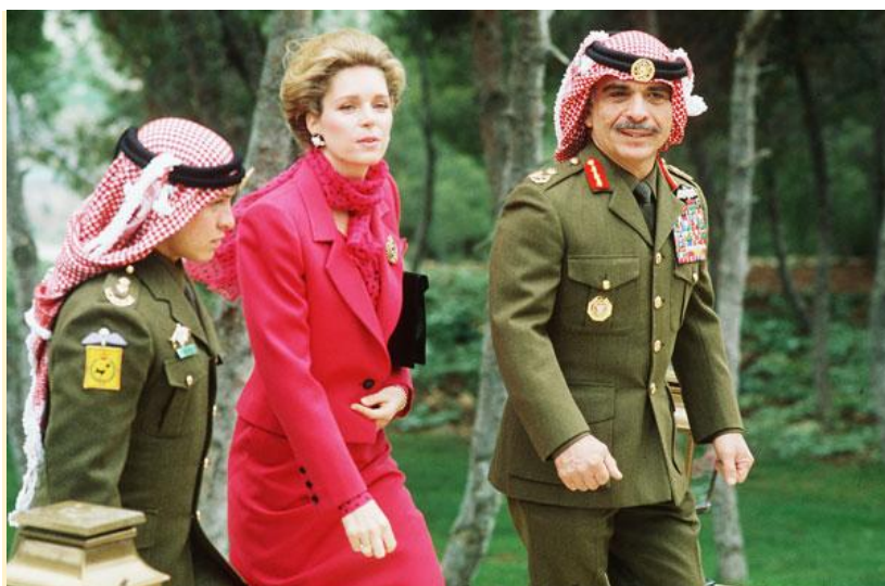
Εικόνα 19. Ο Βασιλέας της Ιορδανίας Χουσεΐν με την Βασίλισσα και τον Διάδοχο Αμντάλα.

Ήταν μεσημέρι. Έβγαλε τα παπούτσια του ο γέροντας και μπήκε στο τζαμί με το βασιλιά.