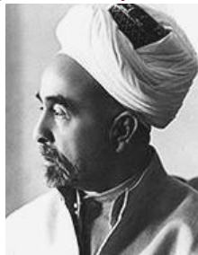
Εικόνα 16. Ο Βασιλέας της Ιορδανίας Αμπντάλα ο Α΄.

Μέχρι το 1951 βασιλιάς ήταν ο Αμπντάλα (Αμπντουλάχ) Α΄ .