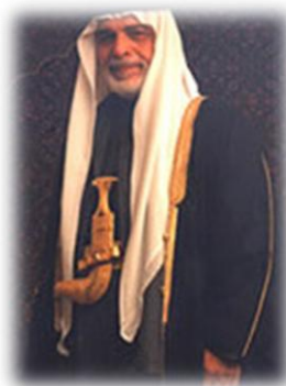
Εικόνα 17. Ο Βασιλέας της Ιορδανίας Χουσεϊν.

Για 2 χρόνια (1951-1952) ο Ταλάλ, , από το 1952 μέχρι το 1999 ο Χουσεϊν .