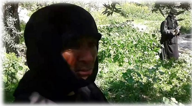
Εικόνα 15. Η Γερόντισσα σε αγροτικές εργασίες.