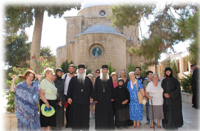
Εικόνα 12. Προσκυνητές στην Ιερά Γυναικεία Μονή Μάρθας και Μαρίας.

Μετά ό Θεός έστειλε κι άλλες αδελφές, πού ζούσαν κοινοβιακά με Ηγούμενο πάντα το σεμνό και ταπεινό πατέρα Θεοδόσιο, ως τις 27 Αυγούστου 1991 , ήμερα πού ό Κύριος τον κάλεσε κοντά του, στην ουράνια βασιλεία του.