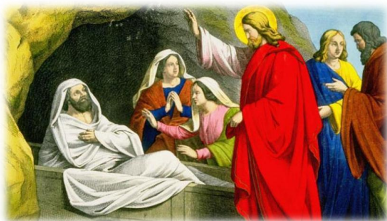
Εικόνα 7. Η Ανάσταση του Λαζάρου.

Το μοναστήρι λέγεται και Μονή της Προϋπάντησης, γιατί εκεί προϋπάντησαν το Χριστό οι αδελφές του Λαζάρου, όταν πήγε για την ανάσταση του Λαζάρου.