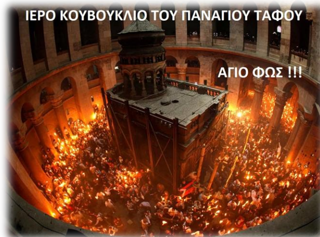
Εικόνα 5. Το Κουβούκλιο του Παναγίου Τάφου υπό το Άγιο Φως.