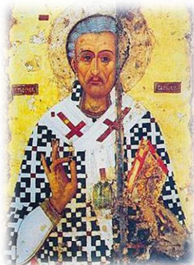
Εικόνα 8. Ο Άγιος Λάζαρος.

Για να αποφύγει την οργή των Ιουδαίων κατέφυγε στην Κύπρο, όπου έγινε πρώτος Επίσκοπος Κιτίου(Λάρνακας).