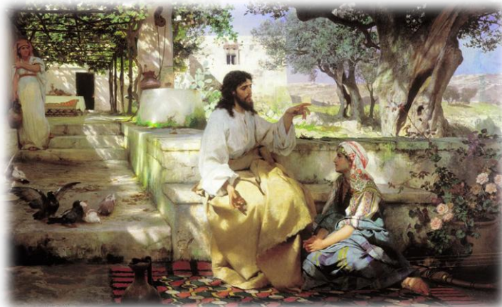
Εικόνα 6. Ο Ιησούς στην οικία του Λαζάρου με την αδελφή του Μαρία.

Το χωριό Βηθανία βρίσκεται 4 χιλιόμετρα ανατολικά της Ιερουσαλήμ, πάνω στο δρόμο προς την Ιεριχώ. Ο Χριστός επισκεπτόταν συχνά τη Βηθανία, γιατί εκτός του ότι ήταν στο δρόμο του για Ιεροσόλυμα, ήταν και η ιδιαίτερη πατρίδα του φίλου του Λαζάρου.