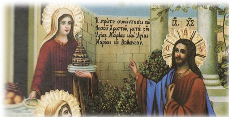
Εικόνα 10. Η Προϋπάντηση του Ιησού με τις αδελφές Μάρθα και Μαρία.

Ένας ευλαβής μοναχός από τη Σμύρνη ο Θεοδόσιος έγινε Φύλακας του Παναγίου Τάφου και το 1947 Αρχιμανδρίτης, στον οποίο ο τότε Πατριάρχης Τιμόθεος ανέθεσε νέο διακόνημα, να είναι φύλακας των ιερών προσκυνημάτων της Βηθανίας Του Αγίου Λαζάρου και του ιερού τόπου, όπου οι δυο αδελφές του Λαζάρου, Μάρθα και Μαρία, προϋπάντησαν τον Ιησού.