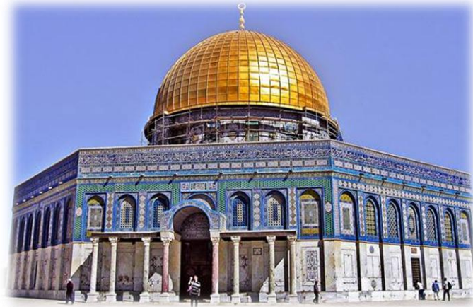
Εικόνα 3. Το τζαμί του Ομάρ χρισμένο πάνω στα ερείπια του ναού του Σολομώντα.