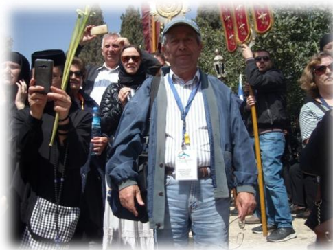
Εικόνα 25. Λιτανεία στον τάφο του Λαζάρου 2017

Αξίζει τον κόπο ο κάθε Ελληνορθόδοξος Χριστιανός να επισκεφθεί το σημερινό μοναστήρι της Μάρθας και Μαρίας στη Βηθανία, εκεί κοντά στην Αγία Ιερουσαλήμ και να προσκυνήσει και στον τάφο του μακαριστού γέροντα Θεοδοσίου.