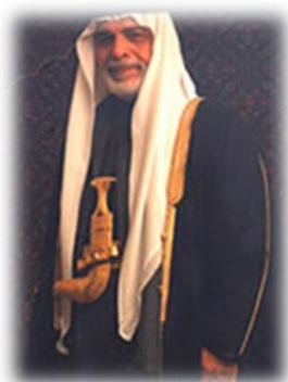
Εικόνα 20. Ο Βασιλέας της Ιορδανίας Χουσεΐν.

Για την ιστορία αξίζει να θυμηθούμε ότι η Ιορδανία με ηγέτη το Χουσεΐν ήταν η μόνη Αραβική χώρα που πολέμησε γενναία στον πόλεμο των 6 ημερών το 1967.