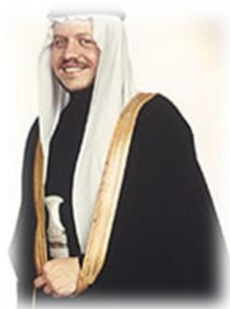
Εικόνα 18. Ο Βασιλέας της Ιορδανίας Αμπντάλα ο Β΄.

Από το 1999 μέχρι σήμερα ο γιός του Χουσεϊν Αμπντουλάχ ο Β΄ και δισέγγονος του Αμπντάλα του Α΄.