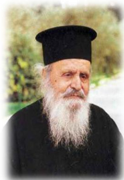
Εικόνα 1. Ο Γέρων της Βηθανίας

Ένας ταπεινός άνθρωπος ήταν και ο Γέροντας της Βηθανίας, ο Θεοδόσιος.