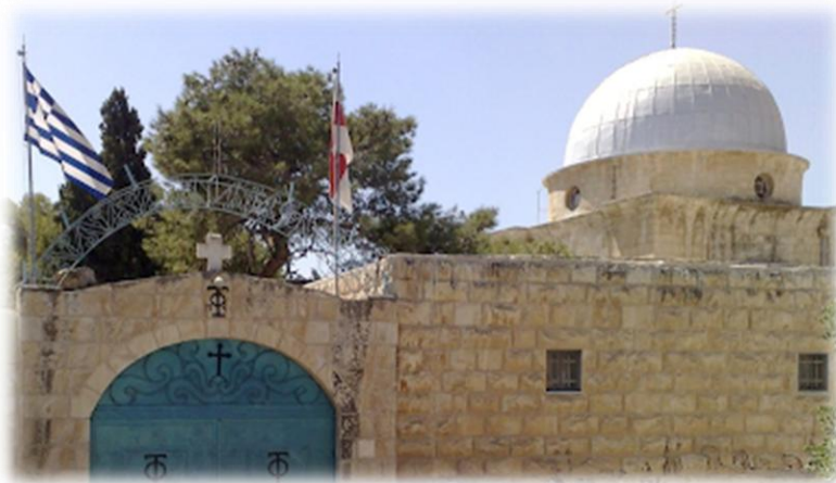
Εικόνα 11. Ιερά Γυναικεία Μονή Μάρθας και Μαρίας.

Εδώ, σ' αυτόν τον ιερό τόπο, υπήρχε μόνον ένας Ναός.