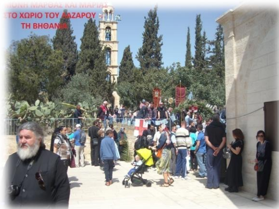
Εικόνα 14. Η Εορτή του Λαζάρου.

Κάθε προσκυνηματικό γκρουπ που επισκέπτεται το μοναστήρι εντυπωσιάζεται με την υποδοχή, τη φιλοξενία, το προσκύνημα σε όλους τους ιερούς χώρους αλλά και με την ταπεινότητα της Γερόντισσας Ευπραξίας και των αγιοταφισίων αδελφών της μονής.