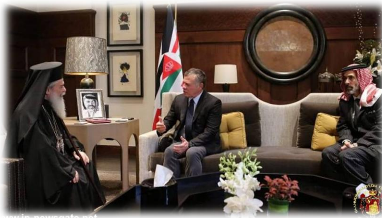
Εικόνα 22. Ο Μακαριώτατος κ. Θεόφιλος με το Βασιλιά Αμπντάλα.

Στο θρόνο της Ιορδανίας ανέβηκε το 1999.