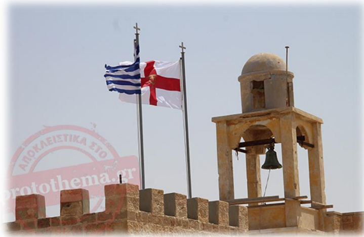
Εικόνα 24. Η Ιερά Μονή Μάρθας και Μαρίας στη Βηθανία.

Στη σημερινή μουντή και προβληματική για όλους μας εποχή, πραγματικές ιστορίες απλοϊκών ανθρώπων όπως αυτή του γέροντα της Βηθανίας, ενδυναμώνουν την πίστη μας και μας οδηγούν σε ευχάριστη διάθεση και φρόνημα.