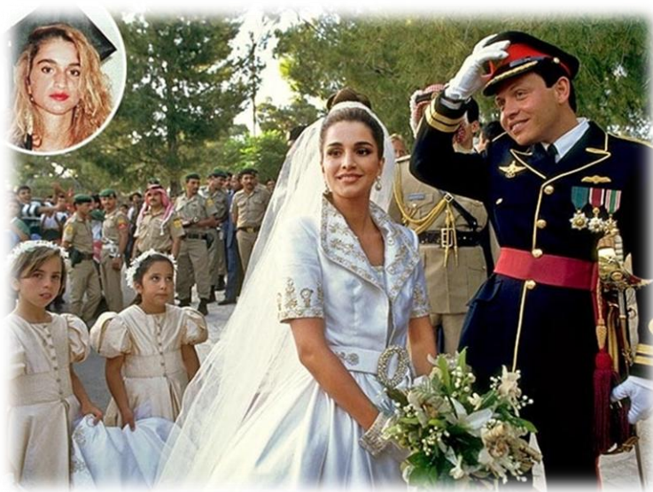
Εικόνα 21. Ο γάμος του Βασιλιά Αμπντάλα.

Ο διάδοχος Αμπντάλα Β΄ , που είχε χριστεί διάδοχος και αντιβασιλέας, σπούδασε και αυτός στη Στρατιωτική Ακαδημία της Αγγλίας όπως και ο πατέρας του.