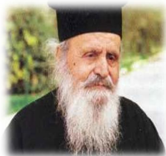
Εικόνα 9. Ο Γέρον της Βηθανίας.

Ένας ευλαβής μοναχός από τη Σμύρνη ο Θεοδόσιος έγινε Φύλακας του Παναγίου Τάφου και το 1947 Αρχιμανδρίτης, στον οποίο ο τότε Πατριάρχης Τιμόθεος ανέθεσε νέο διακόνημα, να είναι φύλακας των ιερών προσκυνημάτων της Βηθανίας Του Αγίου Λαζάρου και του ιερού τόπου, όπου οι δυο αδελφές του Λαζάρου, Μάρθα και Μαρία, προϋπάντησαν τον Ιησού.