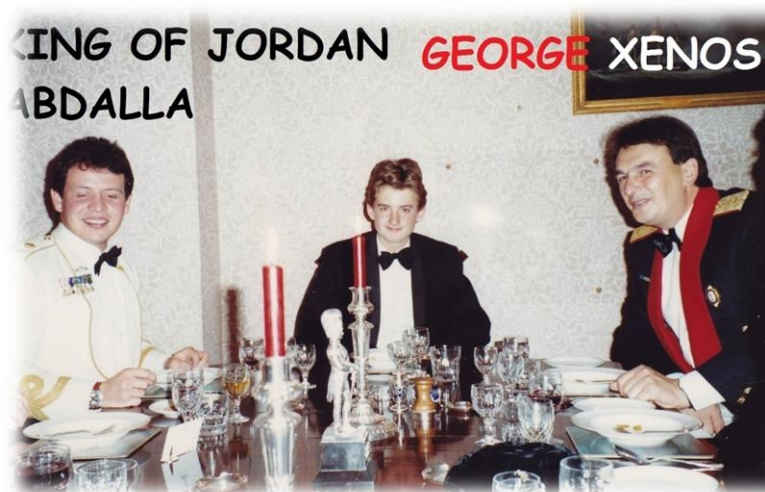
Εικόνα 23. Ο Βασιλιάς Αμπντάλα σπουδαστής.

Και αυτός ενδιαφέρεται για το Ελληνορθόδοξο Πατριαρχείο και είναι πραγματικός φίλος της Ελλάδος. Στο παραπάνω πλάνο ο βασιλιάς Αμπντάλα ως Αξιωματικός μαζί με το Γιώργο Ξένο(δεξιά) ως μαθητές της Αγγλικής Σχολής Πολέμου.