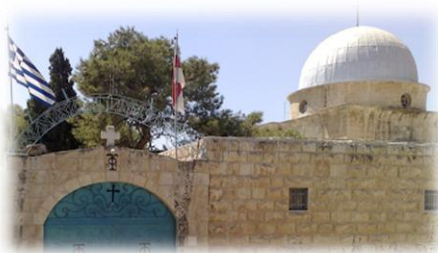
Εικόνα 2. Η Ιερά Μονή Μάρθας και Μαρίας στη Βηθανία.

Αγιοταφίτης Μοναχός του Ελληνορθόδοξου Πατριαρχείου Ιεροσολύμων, ηγούμενος στο ξακουστό μοναστήρι Μάρθας και Μαρίας, στη Βηθανία.